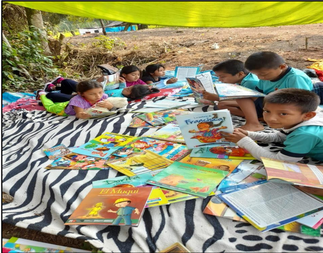
IMAGEN DE LA IE.Nº.0153-SIMÓN BOLÍVAR.