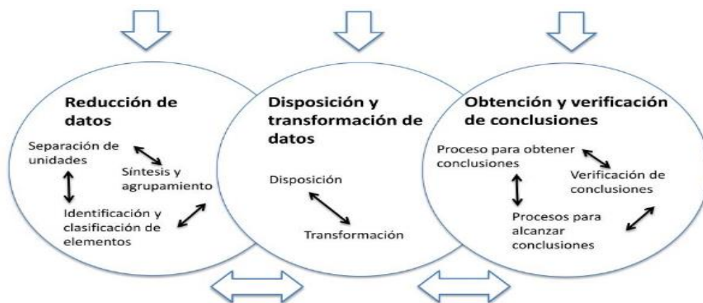
Figura N°1: Método de análisis de los datos de investigación cualitativa

Por ende, el método descriptivo ayudará a desarrollar adecuadamente la descripción de los resultados obtenidos con el instrumento empleado, logrando así contribuir a profundizar en el tema materia de investigación. Finalmente, el método interpretativo será el empleado, esto con el fin de analizar y desarrollar adecuadamente los datos obtenidos, en base a fuentes confiables, para luego