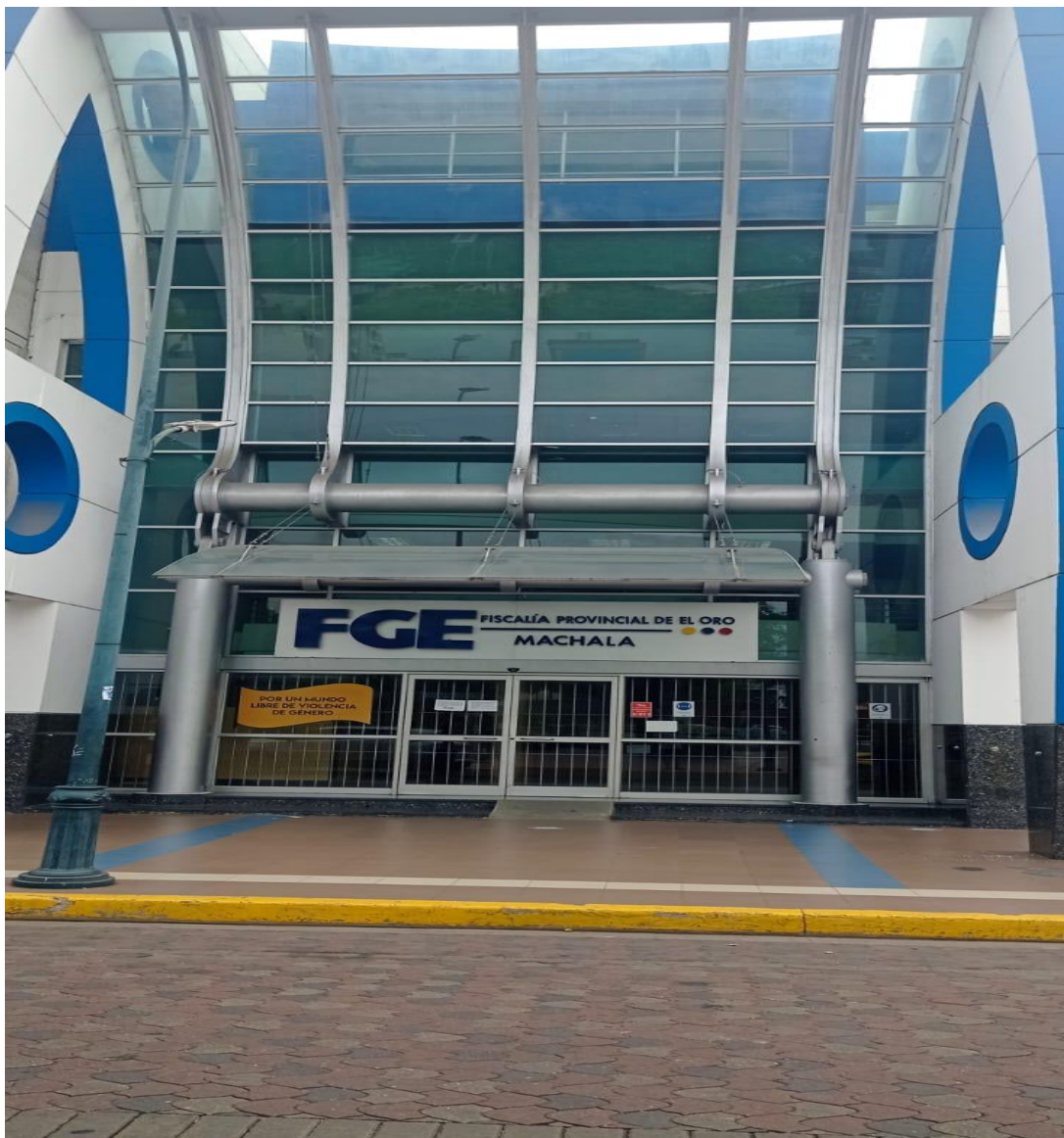
Imagen 1: refiere a la (FGE) fiscalía general del estado, ubicado en la ciudad de Machala donde existen las fiscalías especializadas en tránsito.

El escenario de estudio del proyecto de investigación se desarrolla en la ciudad de Machala, lugar donde se ejecutará de manera activa y donde existe registros sobre el tema, además que los expertos los mismos que serán entrevistados aportaran sobre las experiencias e interrogantes, ya que son especialistas en el tema que se debatirá sobre la realidad problemática planteado, Arias, (2020).