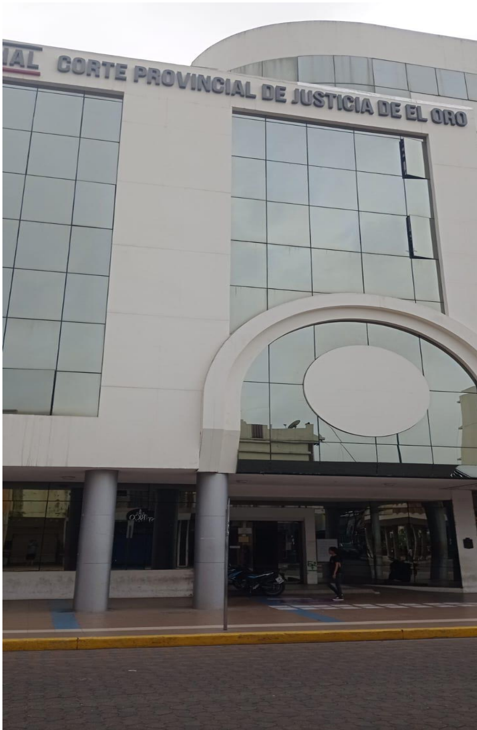
Imagen 2: describe a la Corte Provincial de Justicia de El Oro por ser Machala su capital la misma que se encuentra situada en el centro urbano de la ciudad de Machala y se encuentran las unidades judiciales penales.