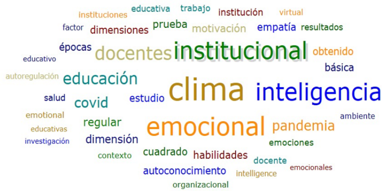
Figura 2: Clima Emocional Clima Emocional.

El clima en un campus educativo es mas resaltante la Inteligencia emocional, debido a que el control de nuestras emociones contribullen al trabajo en equipo, que es necesario para que nuestros colegas o amigos sea con mayur regularidad, con atocnoimiento, empleando las habilidades propias que tenemos, que nos ayudo a superara grandes obstaculos como la pandemia, nos lleva a estudiar de forma mas investigativa dentro del contrrxto que nos encontramos otorgandomos una relacion con el docente muy buena dentro de la institucion educativa, dando como resultado la importancia del contrlo de nuestra emociones requiere un auto regulacion de las mismas. Como se aprecia en la figura 2.