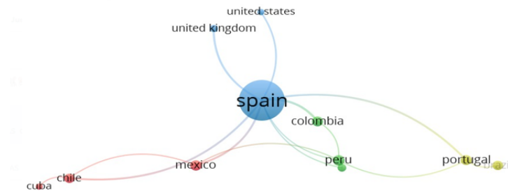
Figura 4: Diagrama de interés de la inteligencia emocional a nivel mundial.