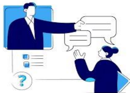
Guía de entrevista

Nota: Extraído de Universidad San Sebastián. https://novo.uss.cl/innovakit/guiade-entrevistas/