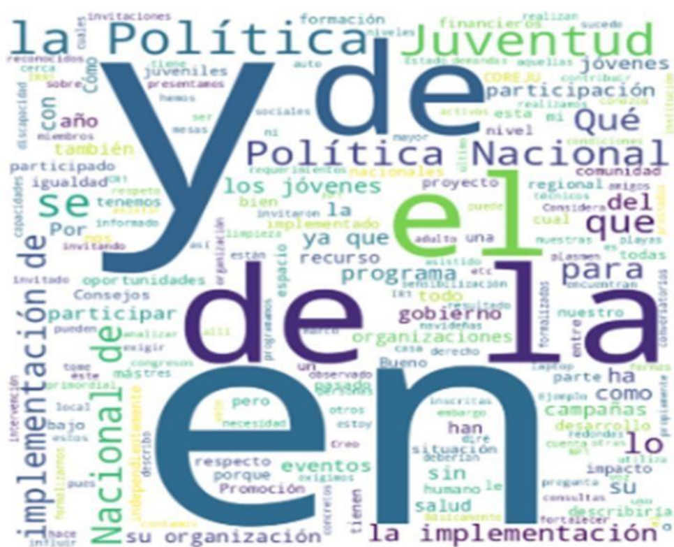
Figura 2 Análisis exploratorio de Entrevista 2

Se realizó en el programa cualitativo de Atlas Ti V.9 del entrevistado 1, se observa en la figura 1, la referencia de los temas que priman en la respuesta de la entrevista, siendo las palabras claves como, juventud, política, participación, implementación, construcción entre otras que dan soporte a lo mencionado.