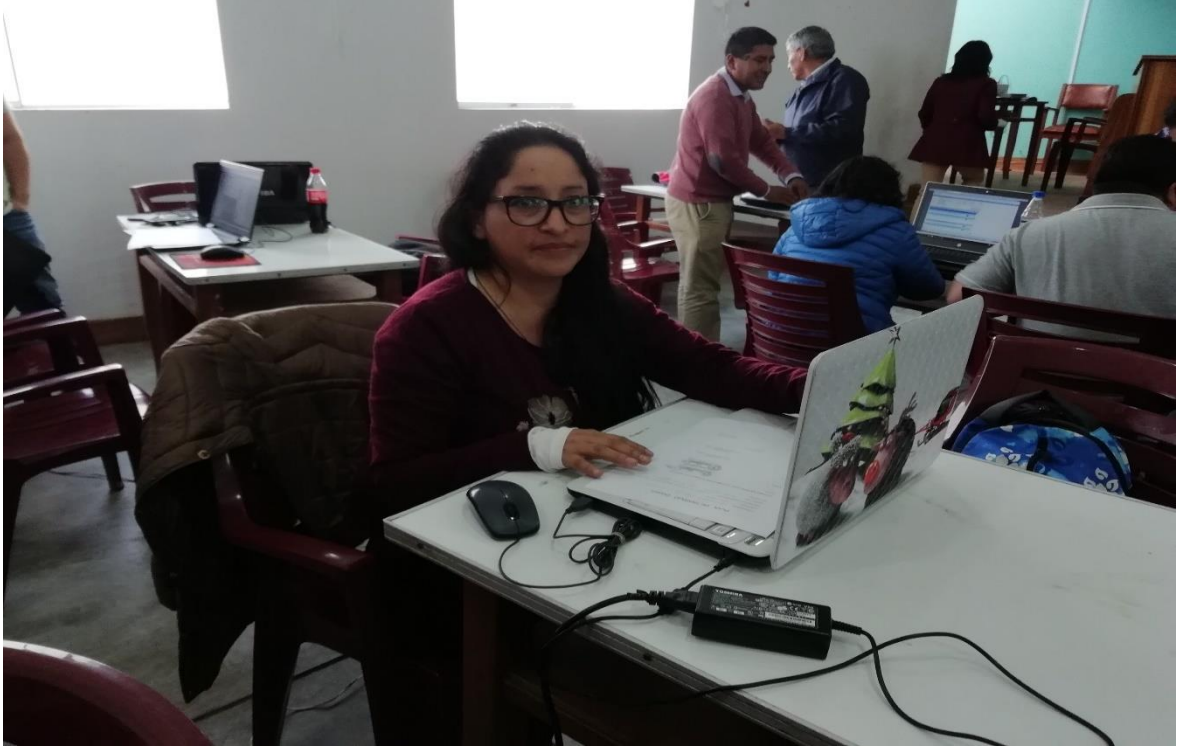
Foto con algunos integrantes de la entidad