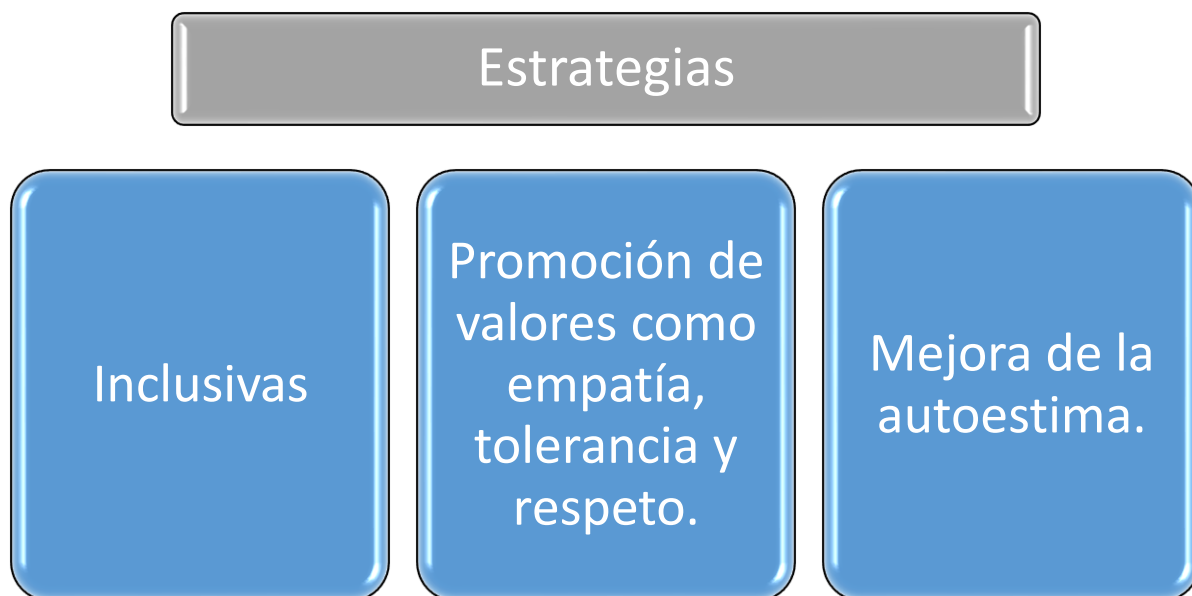
Figura 3: Estrategias