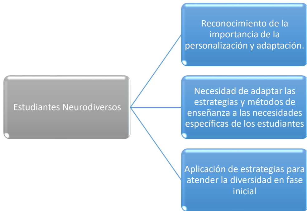
Figura 1: Estudiantes Neurodiversos