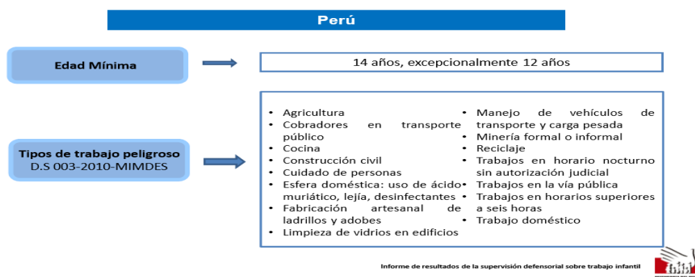
Figura 1. Informe de resultados de supervisión defensorial sobre trabajo infantil.

adoptar las medidas necesarias para erradicar toda actividad laboral realizada por niños, niñas y adolescentes que no se ajuste a lo previsto en estos convenios.