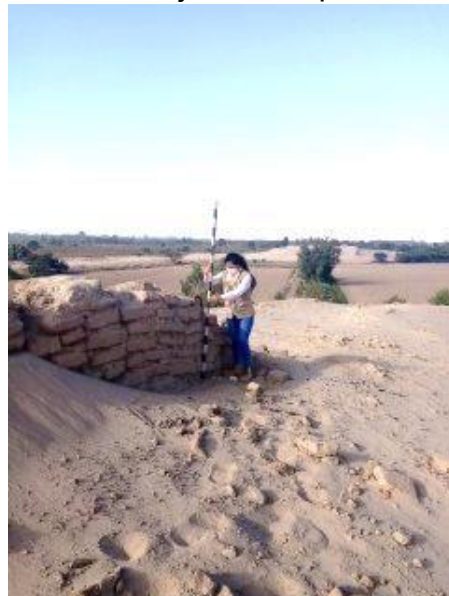
Nota. Investigadora realizando trabajo de campo en Villacuri