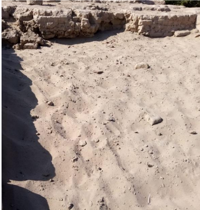
Nota. Huaca Guadalupe