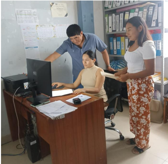
Nota. Revisión en la base de datos de la Empresa Inversiones Cleo & Segu Contratistas Generales SRL.