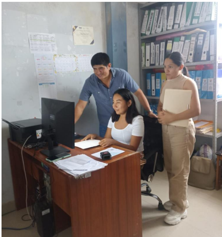
Nota. Revisión en la base de datos de la Empresa Inversiones Cleo & Segu Contratistas Generales SRL.