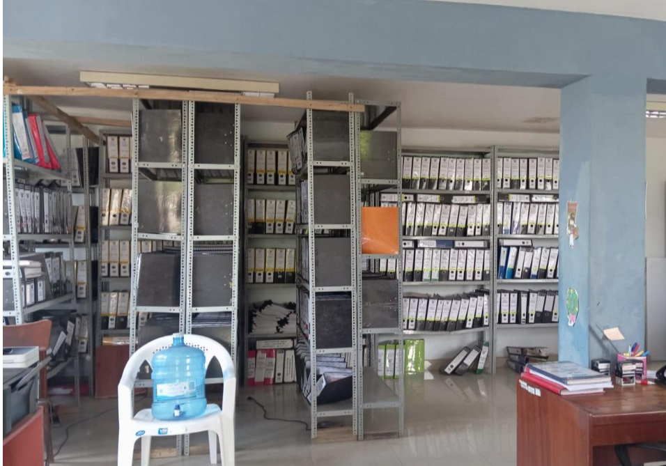
Nota. Oficina de Contabilidad la Empresa Inversiones Cleo & Segu Contratistas Generales SRL.