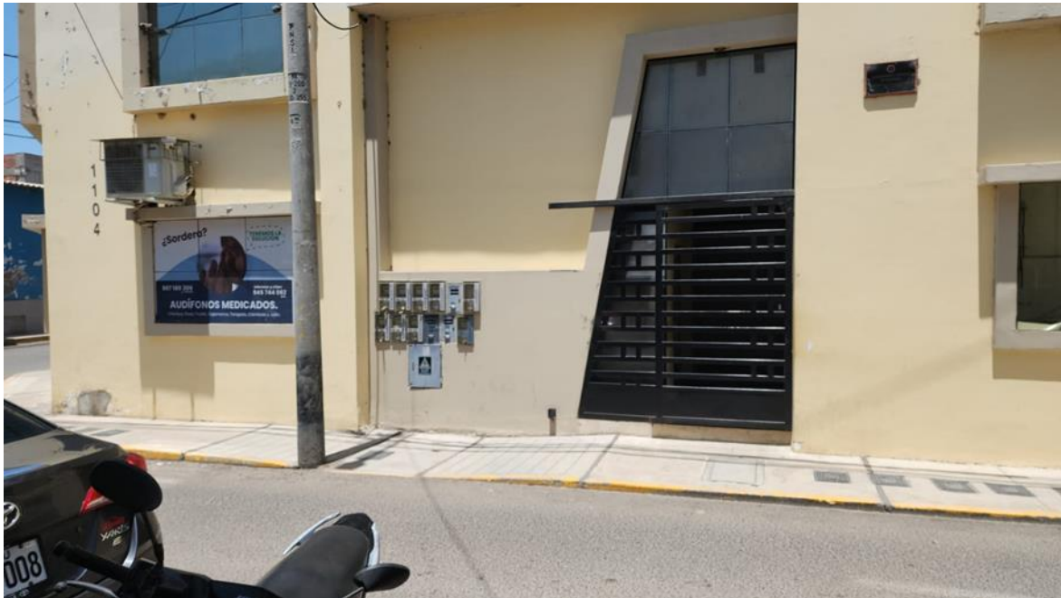
Nota. Vista Frontal de La Empresa Inversiones Cleo & Segú Contratistas Generales SRL.