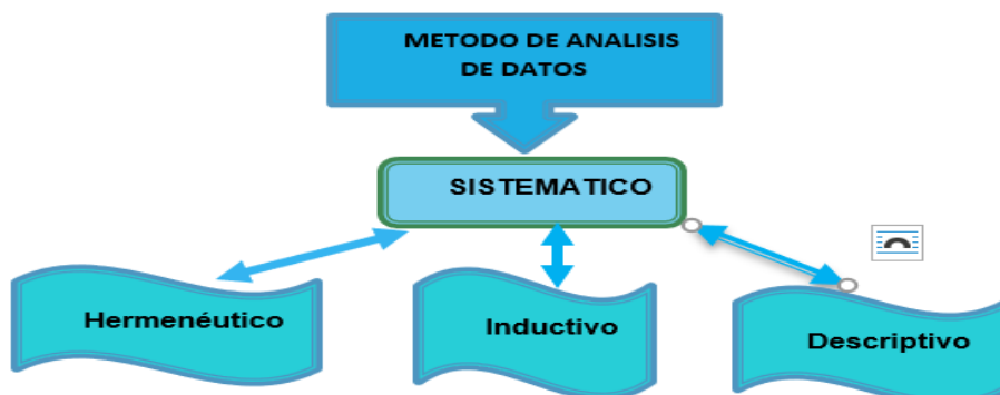
Figura 1. Gráfico de métodos de análisis de información aplicables al presente estudio.