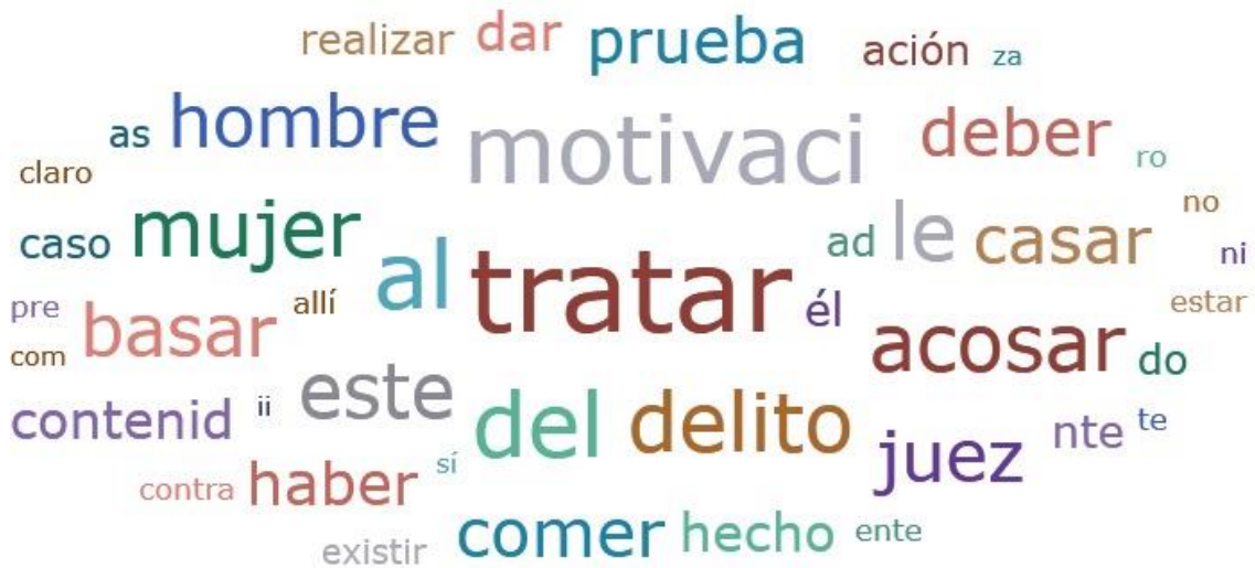
Figura 3. Análisis de nube de ideas de Atlas.ti acorde al objetivo específico 2

Nota. Elaboración propia con el programa Atlas.ti