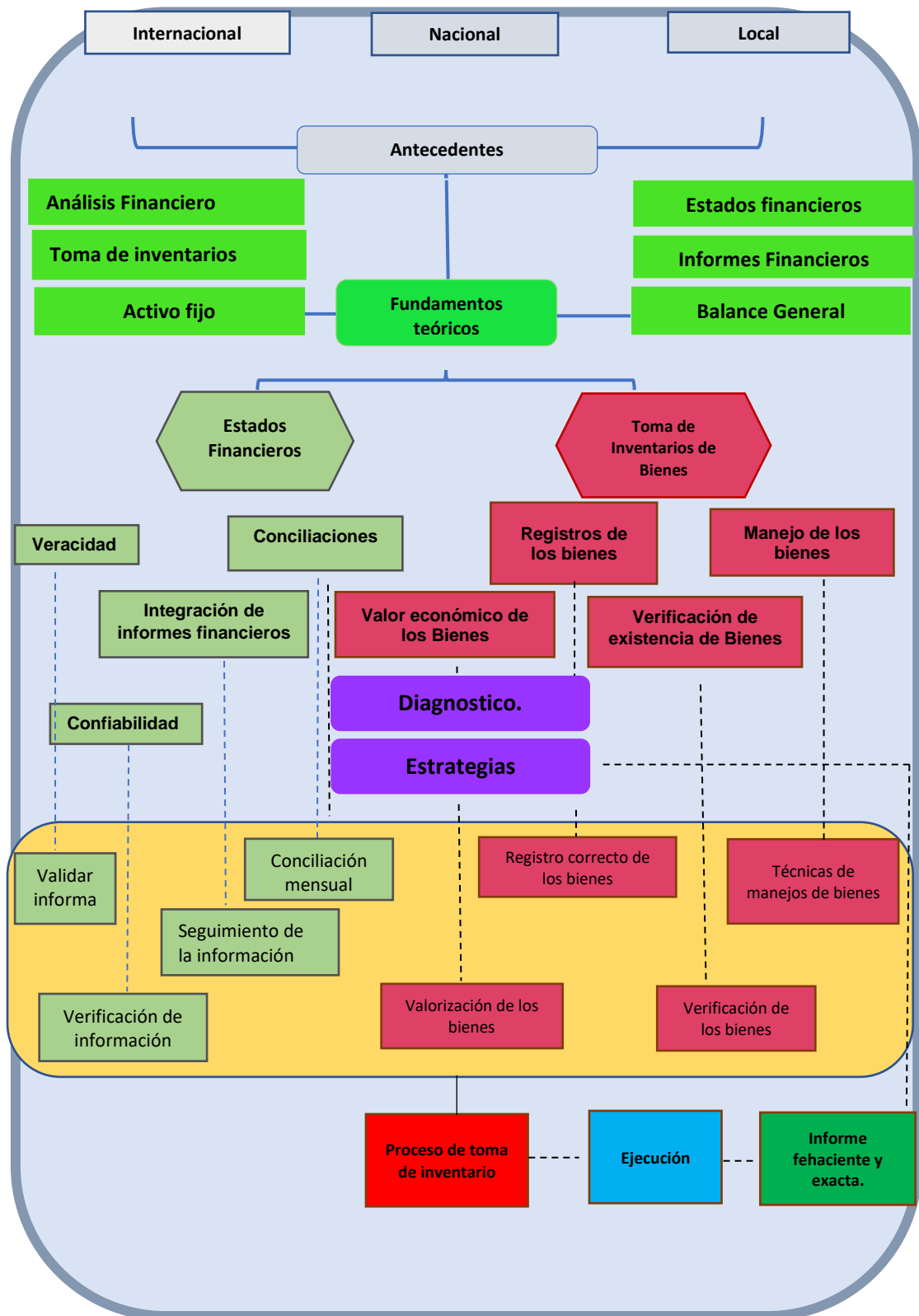
Figura 1: Diseño de la Propuesta.

Objetivo específico 1: Describir la percepción de la dimensión planifica