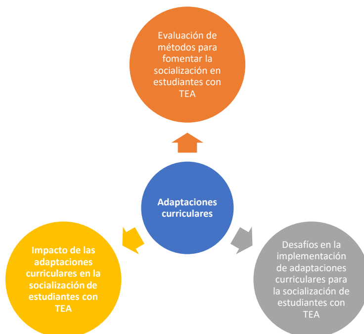
Figura 3. Adaptaciones curriculares

Objetivo Específico 2: Conocer cómo las adaptaciones curriculares mejoran el nivel de socialización en estudiantes con Trastorno del Espectro Autista en una institución educativa de nivel inicial en Cajamarca. Las adaptaciones curriculares destinadas a mejorar el nivel de socialización de los estudiantes con TEA también estaban en una fase inicial. Los docentes comenzaron a formar grupos de habilidades sociales y aplicar métodos específicos, pero estos esfuerzos aún no estaban completamente desarrollados. Un docente afirmó que "hemos implementado grupos de habilidades sociales para fomentar la interacción entre los estudiantes, pero todavía estamos en la etapa inicial de este proceso y necesitamos evaluar su efectividad a largo plazo" (Respuesta - subdirector). Este comentario destaca la importancia de un seguimiento y evaluación continuos para determinar el impacto de estas adaptaciones. Otro docente indicó que "hemos notado que la participación en actividades grupales ha mejorado, pero los desafíos iniciales, como la falta de apoyo de los padres y recursos adecuados, han dificultado el progreso sostenido" (Respuesta - Coordinador de tutoría). La implicación de los padres y la disponibilidad de recursos son factores cruciales que influyen en la efectividad de las adaptaciones curriculares.