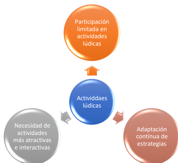
Figura 2. Actividades lúdicas

Docente 4: “Las actividades lúdicas ayudan, pero necesitan ser más interactivas y atractivas.”