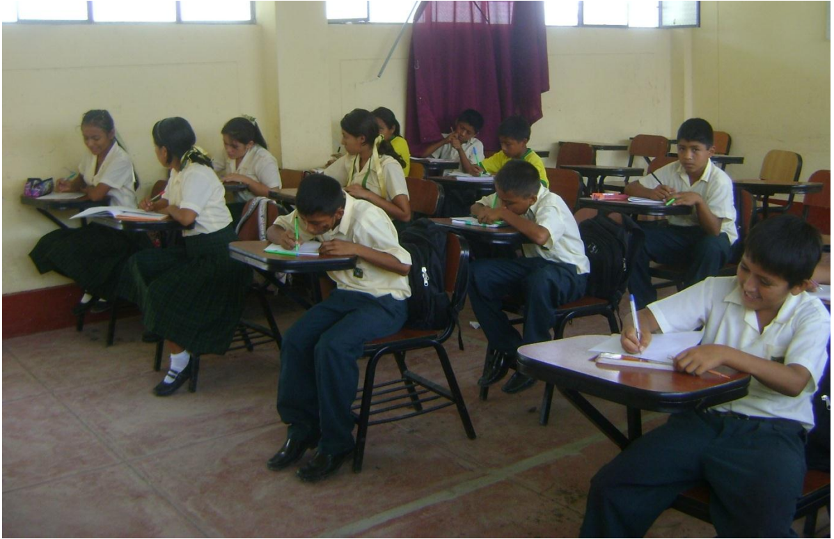
Alumnos desarrollando el segundo Test