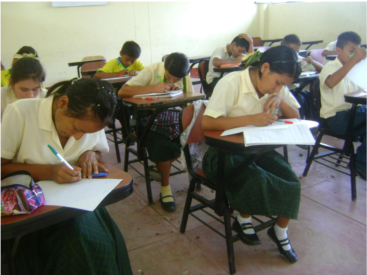
Alumnos desarrollando el primer test