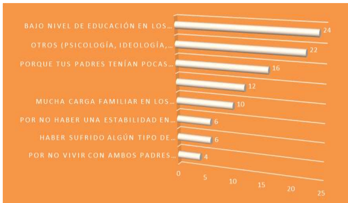
Grafico N° 1.- Dimensiones Sociales