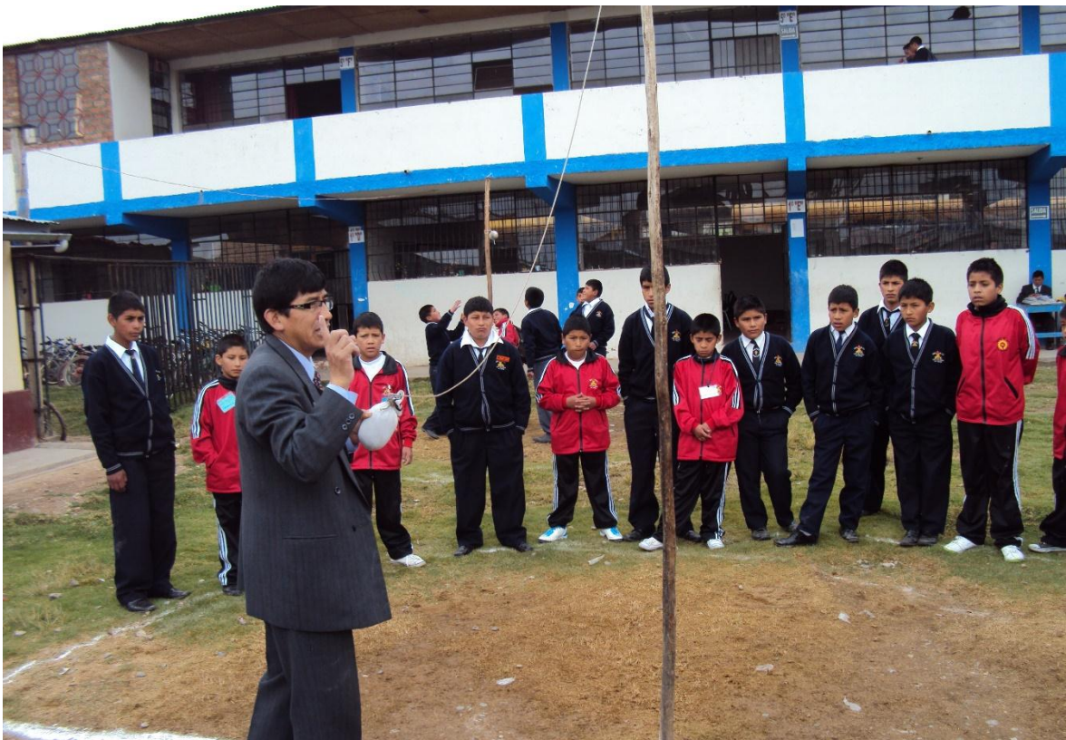
Descripción: Actitud docente. Proactivo