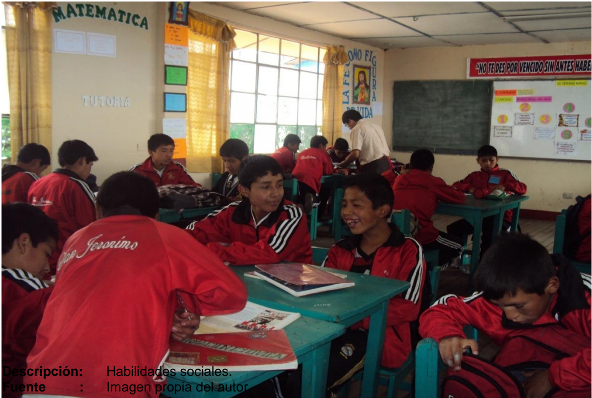
Descripción: Habilidades sociales.