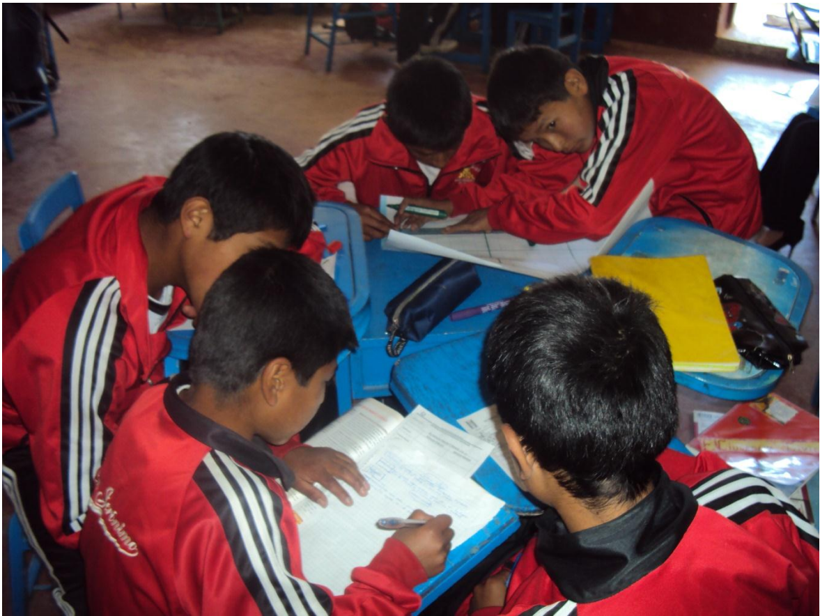
Descripción: Trabajo cooperativo. Participación