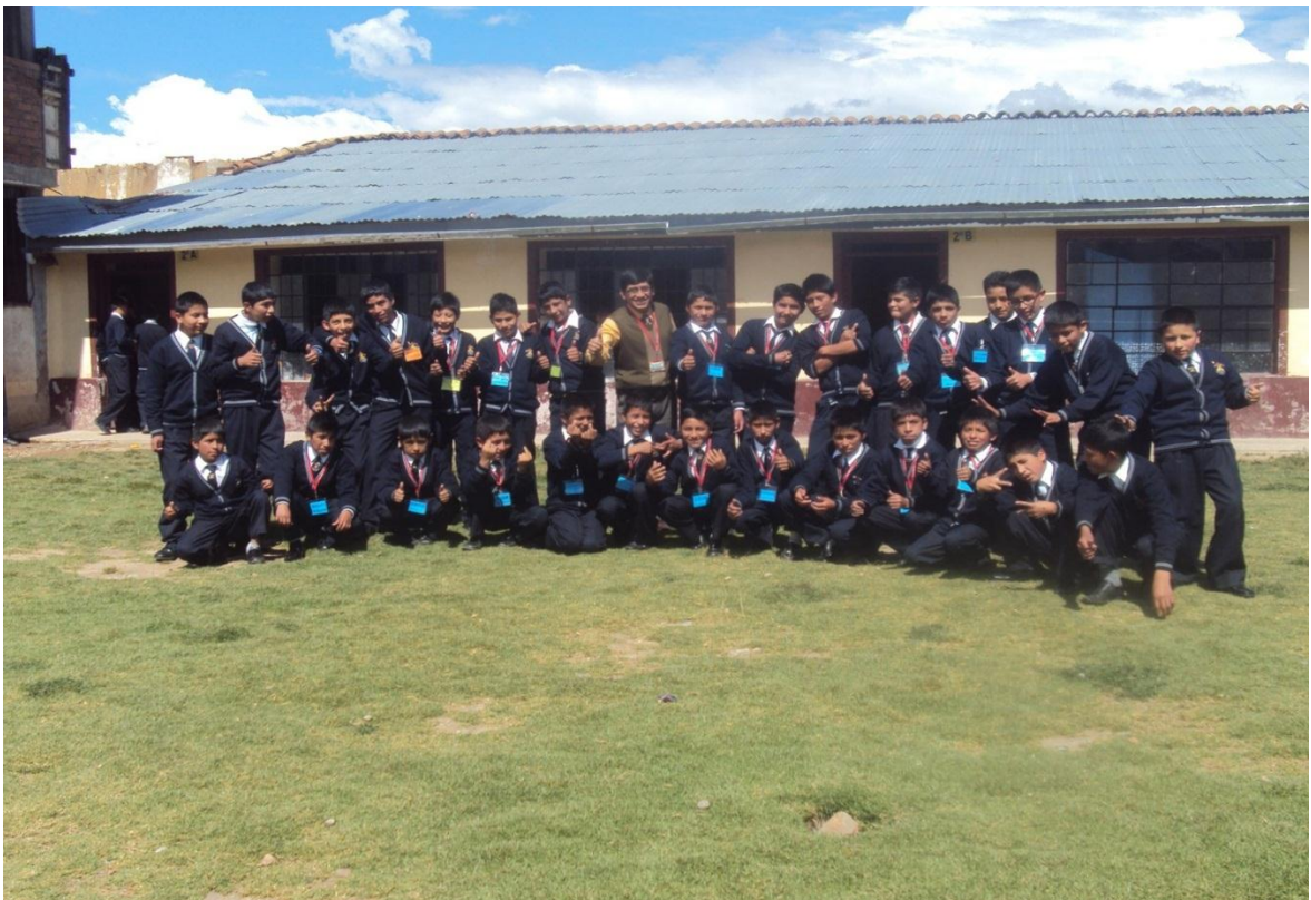
Descripción: Estudiantes del Segundo Grado "B"