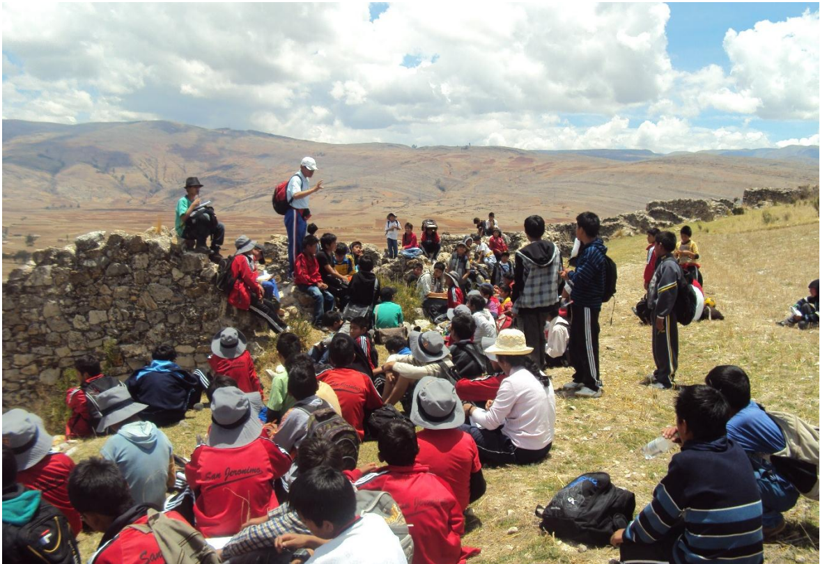
Descripción: Actitud docente. Proactivo