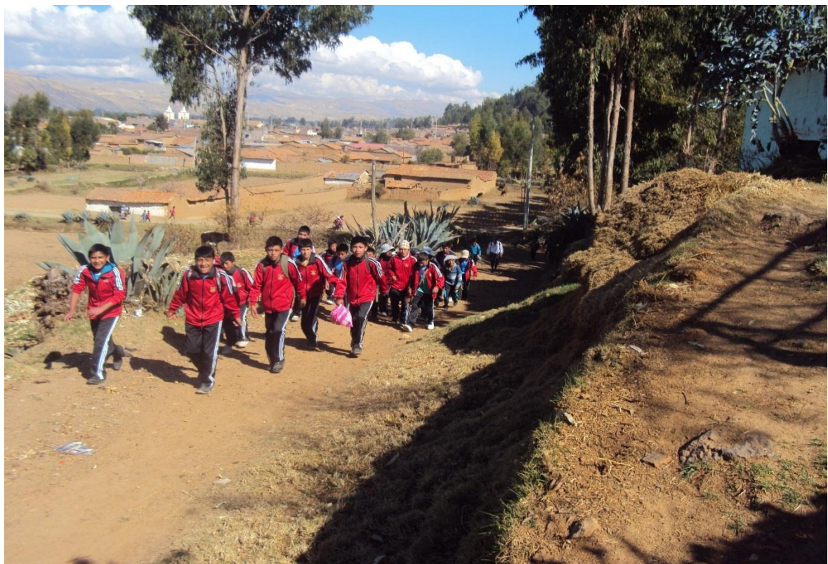
Descripción: Actitud docente. Proactivo