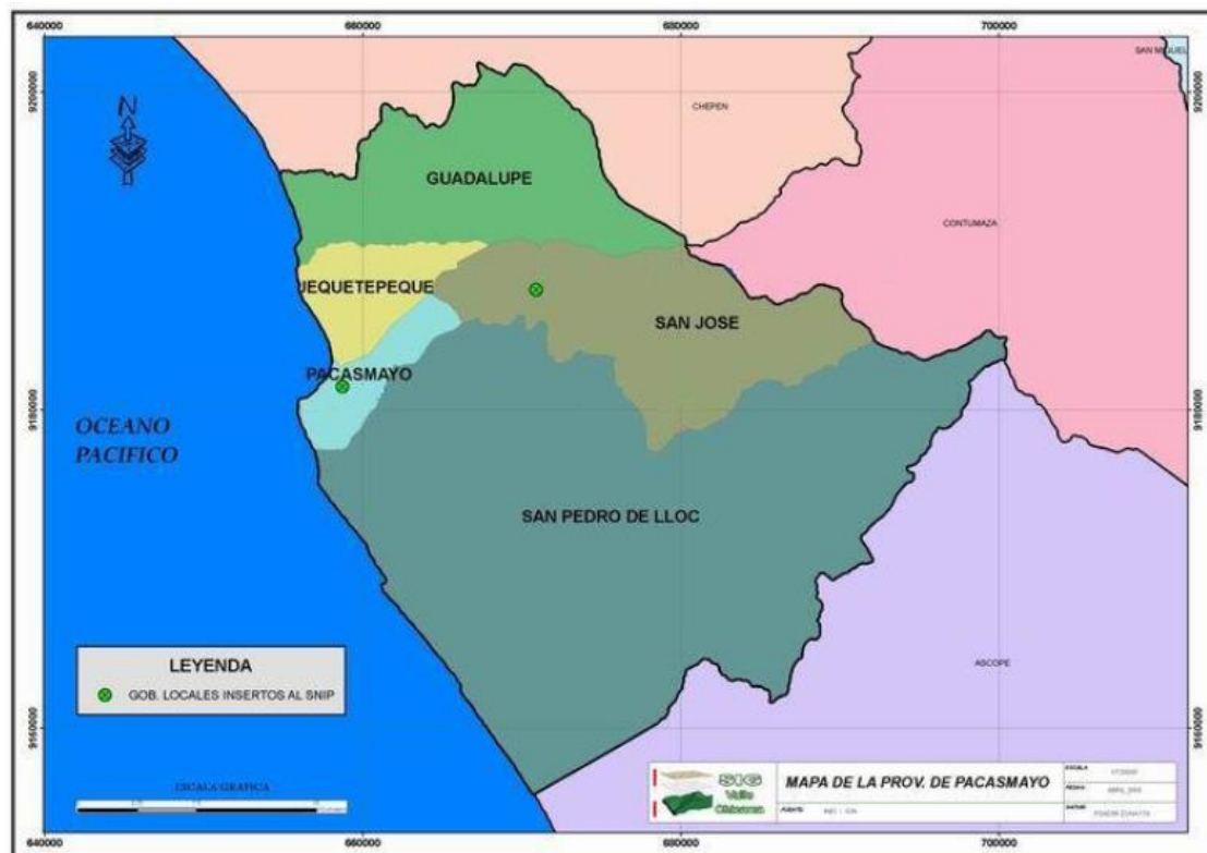
Figura N° 01 Mapa Geopolítico de la Provincia de Pacasmayo