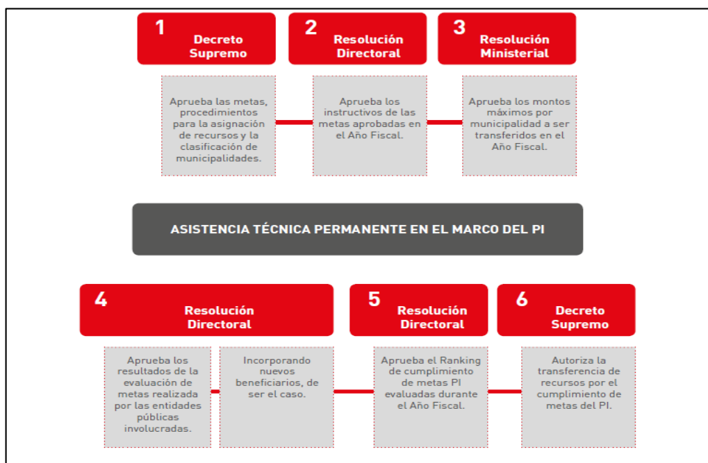
Figura N° 02: Es esta imagen se detallan los instrumentos del marco normativo, que son empleados por el PI en cada una de sus etapas. Obtenido del Brochure del PI 2017.