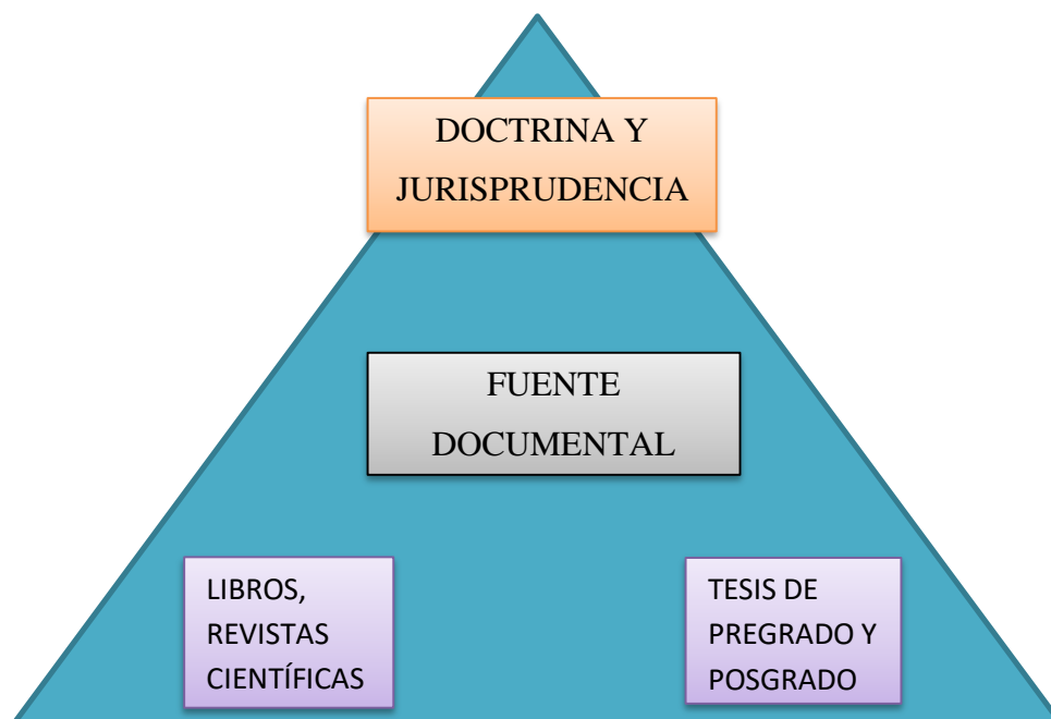
Figura 2 Resultados de análisis de fuentes documentales.