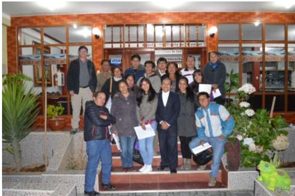
Reunión de Sensibilización con empresarios de la Cámara Provincial de Turismo de la Provincia de Tarma