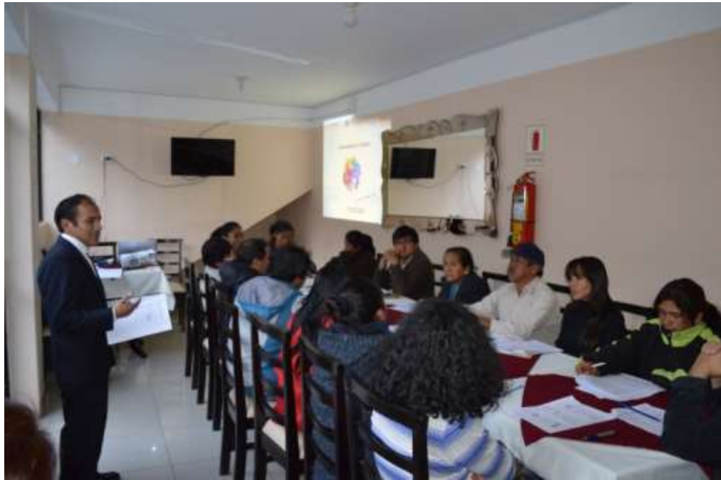
Desarrollo Taller N° 1 “Cómo mejorar el formalidad empresarial en alojamiento y turismo”