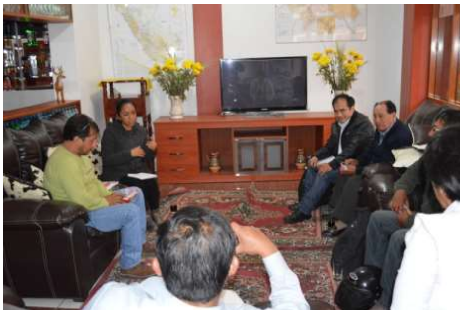
Taller 2 “Creencias sobre la informalidad empresarial”