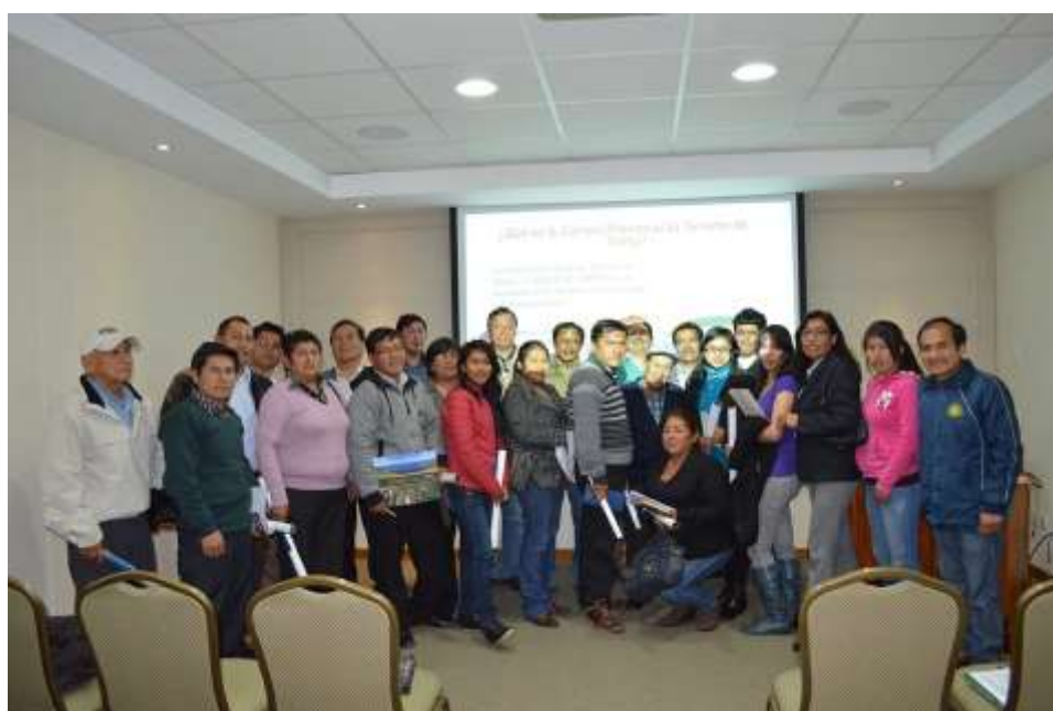
Taller 3 “Ventajas de la Formalidad Empresarial”