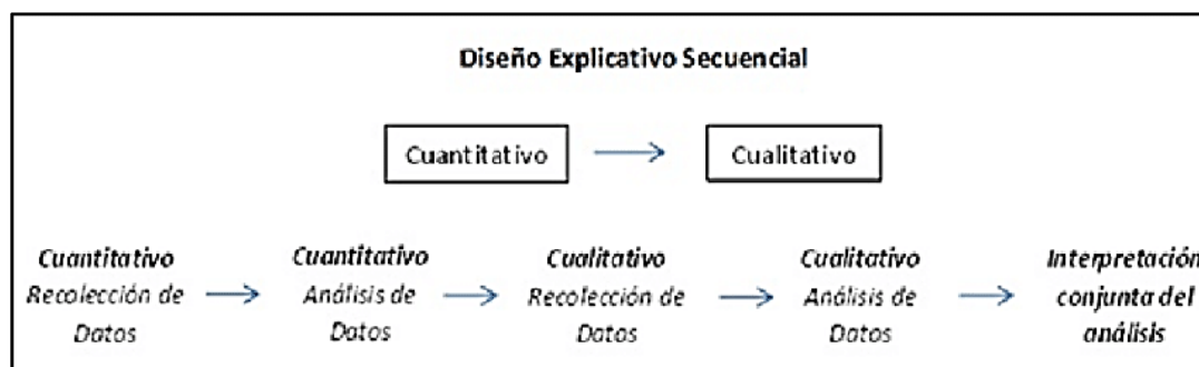
Figura 1: Diseño secuencial exploratorio

Se usó el enfoque cuantitativo y cualitativo de manera concurrente, manteniendo ambos métodos separados e independientes durante el análisis para ser combinados durante una interpretación conjunta.