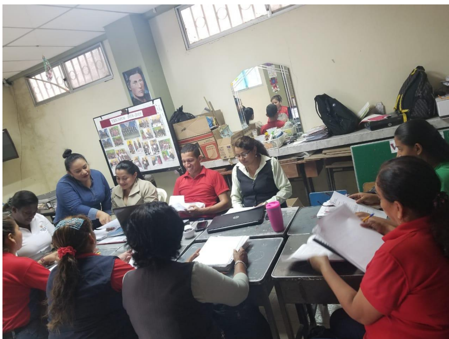
Figura 2: Aplicación de instrumentos a docentes de la Unidad Educativa Fiscal PCEI “Manuel Wolf Herrera” el día 18 de noviembre de 2019, a horas 14:00 p.m.