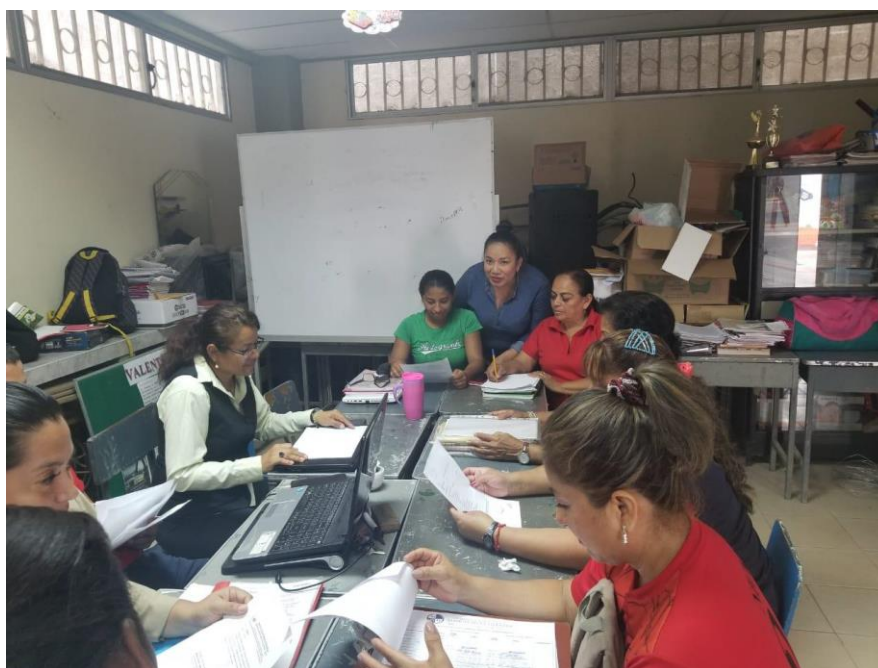
Figura 1: Aplicación de instrumentos a docentes de la Unidad Educativa Fiscal PCEI “Manuel Wolf Herrera” el día 18 de noviembre de 2019, a horas 14:00 p.m.