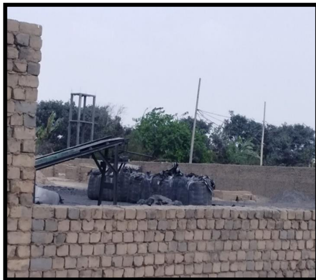
ANEXO 5: Maquinaria utilizada para triturar carbón