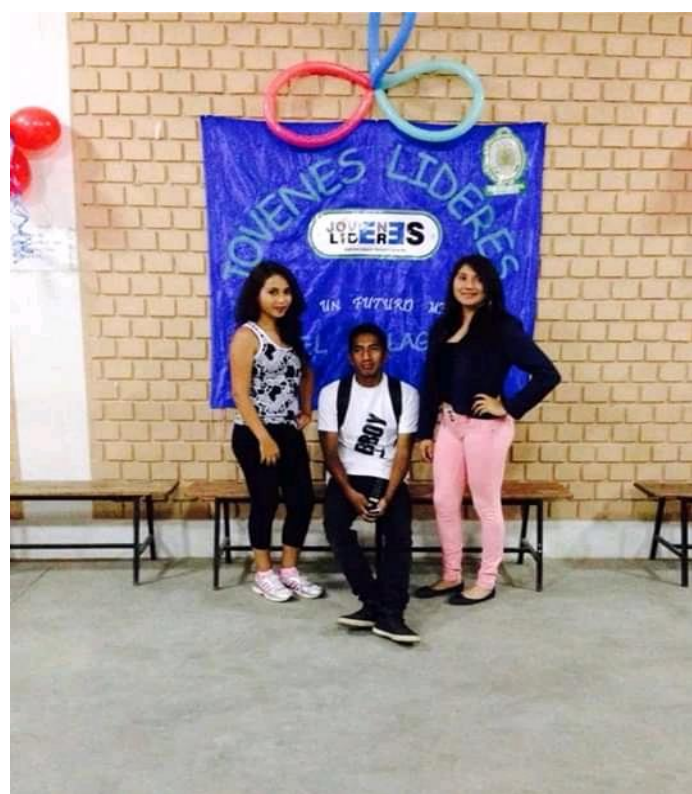
Fotografía 4. Programa de Prevención Estratégica del delito del Ministerio Público.