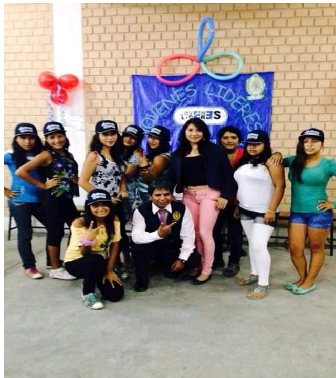
Fotografía 1. Programa de Prevención Estratégica del delito del Ministerio Público.