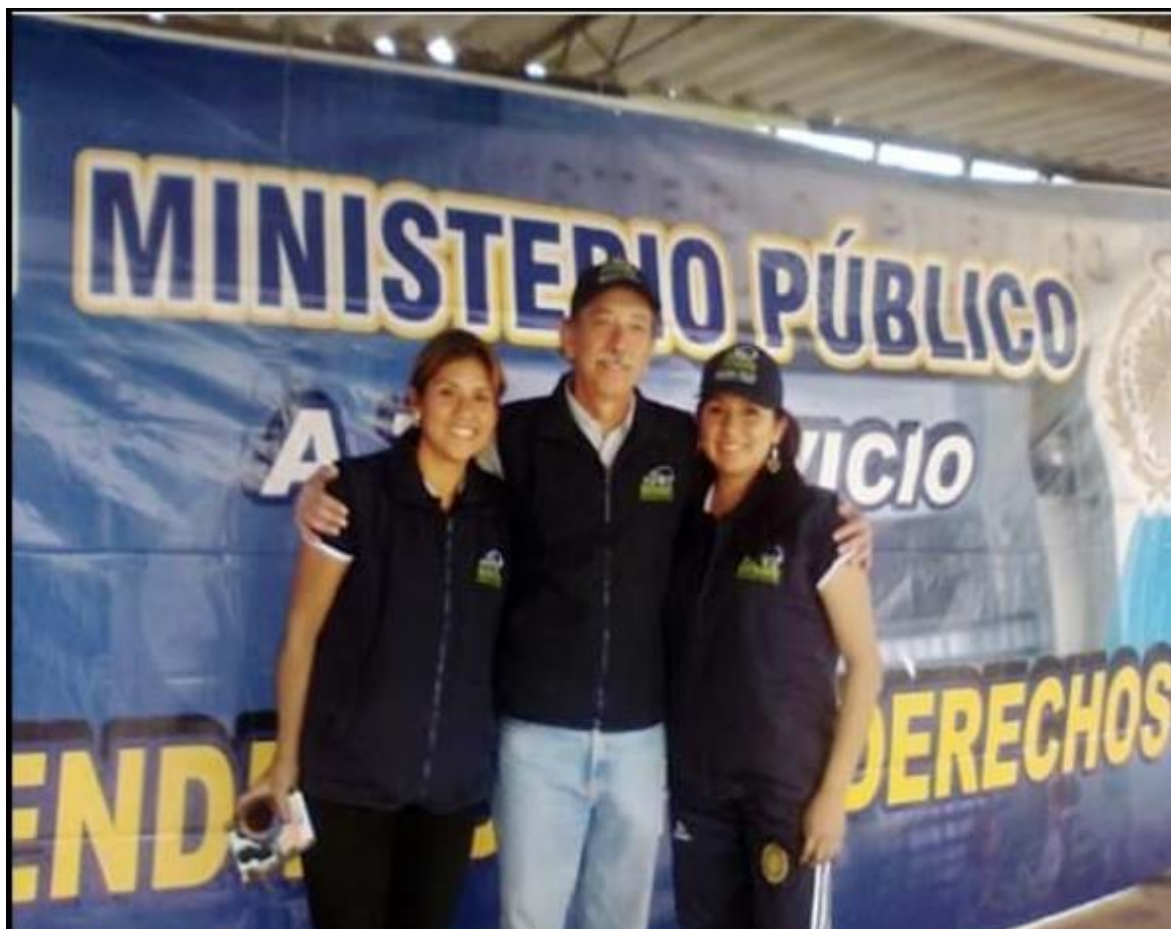
Fotografía 5. Programa de Prevención Estratégica del delito del Ministerio Público