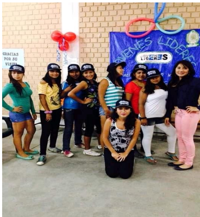
Fotografía 2. Programa de Prevención Estratégica del delito del Ministerio Público.