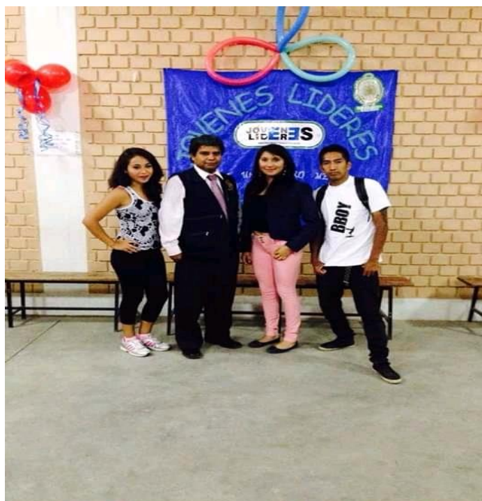
Fotografía 3. Programa de Persecución Estratégica del delito del Ministerio Público.