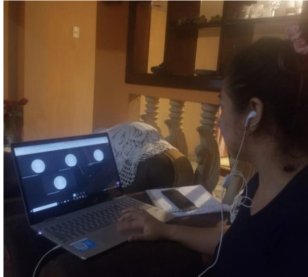
Imagen 1: Desarrollo del proyecto de investigación

Fotos, planos y otros documentos que ayuden a esclarecer más su investigación