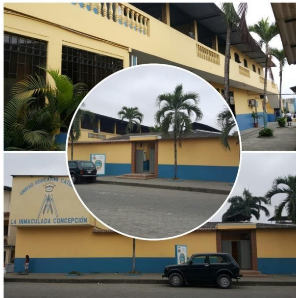
Imagen 2: Institución Educativa "La Inmaculada Concepción"