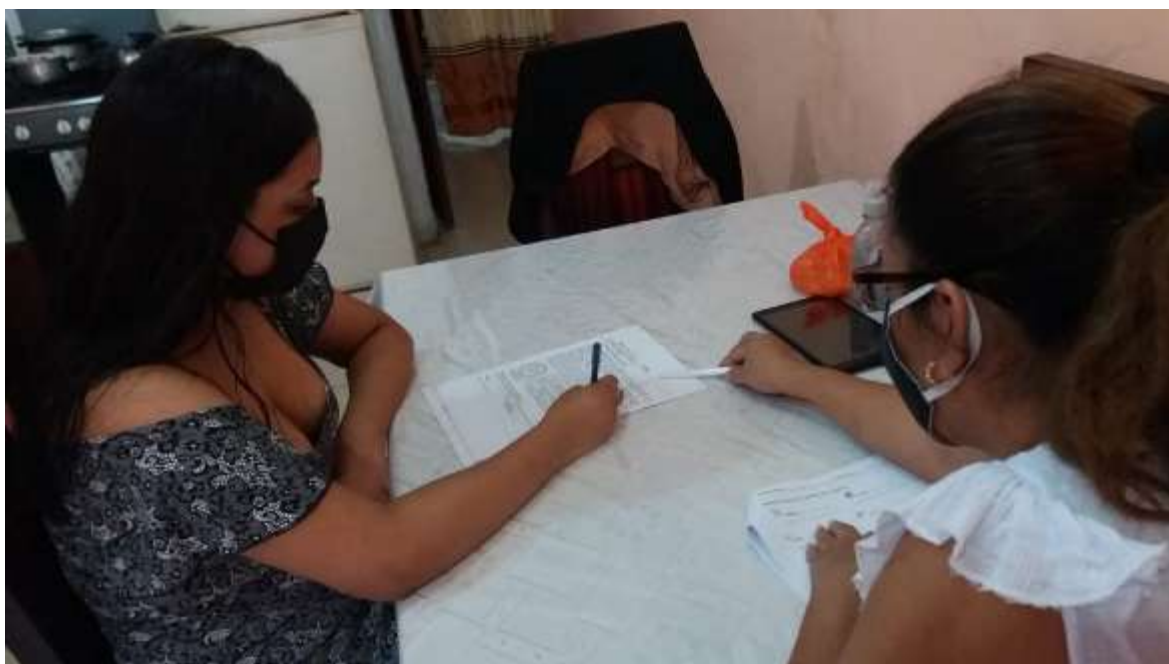
Gráfico 1: Evidencia fotográfica 1, aplicando la encuesta