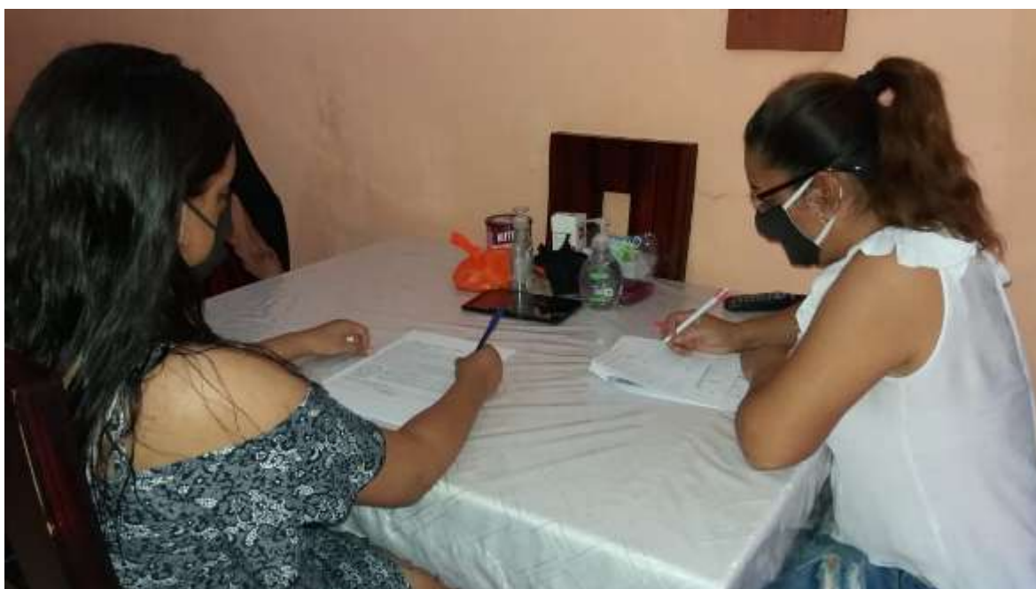
Gráfico 2: Evidencia fotográfica 2