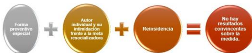
GRAFICO N° 1: Las pretensiones de la Reinserción por Claus Roxin

Claus Roxin, da un claro ejemplo de lo que sucede en nuestro sistema penal juvenil, el mismo que no está siendo efectivo, y esto se demuestra con la reincidencia del delito más común en nuestra sociedad, que como el Código Penal define el robo