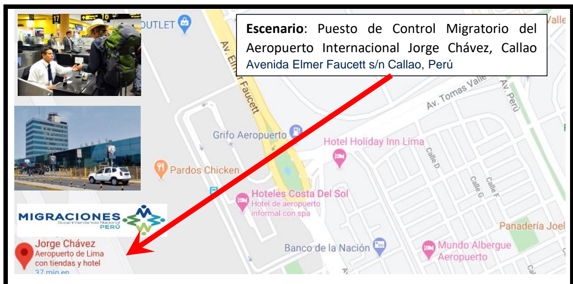
Figura N° 01

Es ubicar el escenario donde se va a desarrollar la investigación, el mismo que permite lograr un acercamiento a la realidad. En esa línea, el presente estudio se focaliza en el Puesto de Control Migratorio del Aeropuerto Internacional Jorge Chávez, Callao.