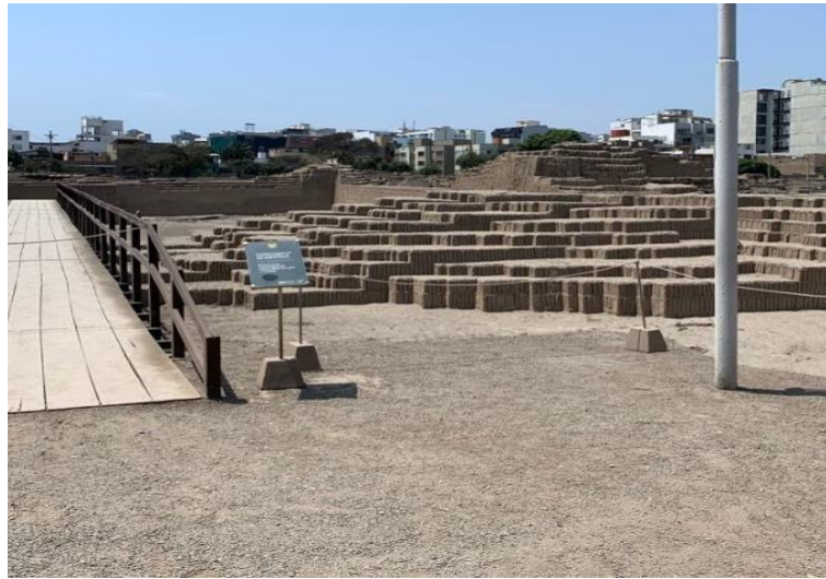
Área de punto de partida del tour