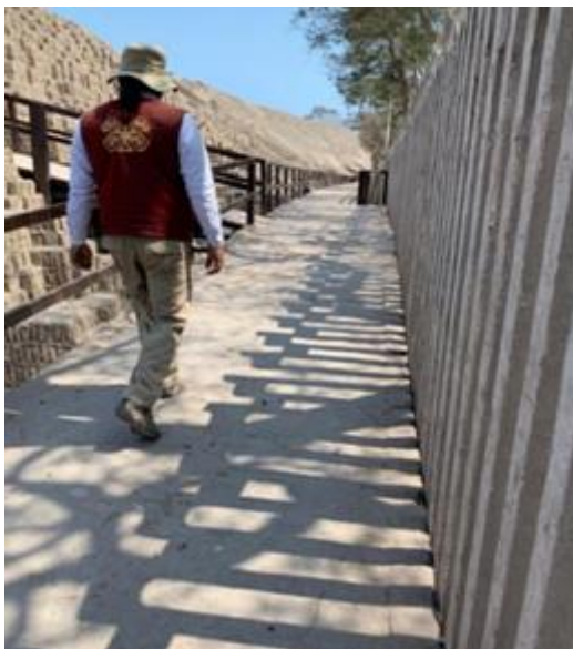
Imagen 23: Explicación del tour