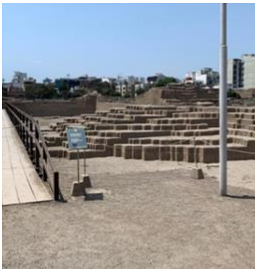
Imagen 19: Entrada de la Huaca Pucllana