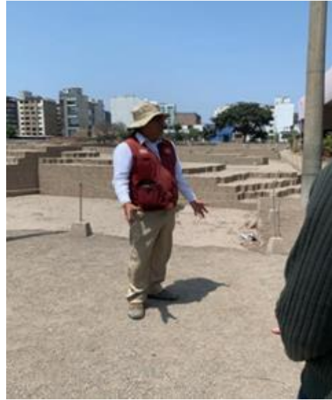
Imagen 18: Guía oficial del turismo