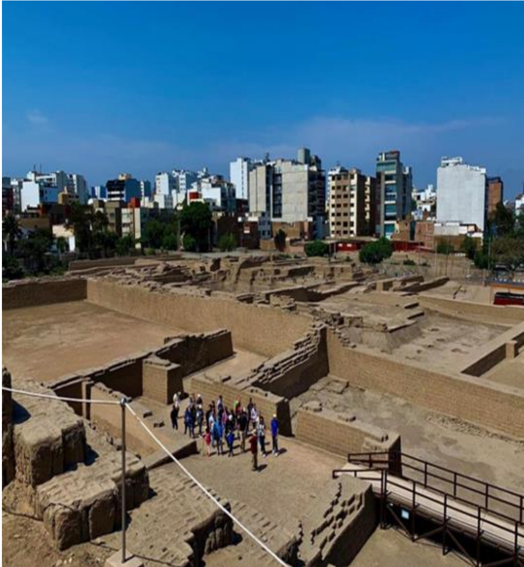
Imagen 25: Huaca Pucllana