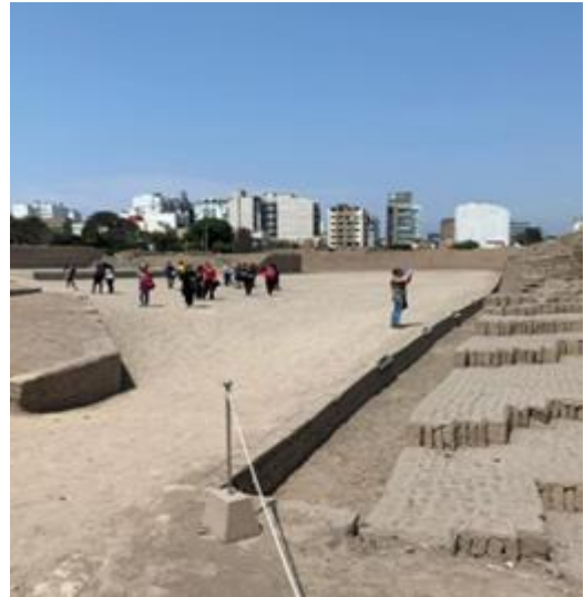
Imagen 20: Tour en la Huaca Pucllana