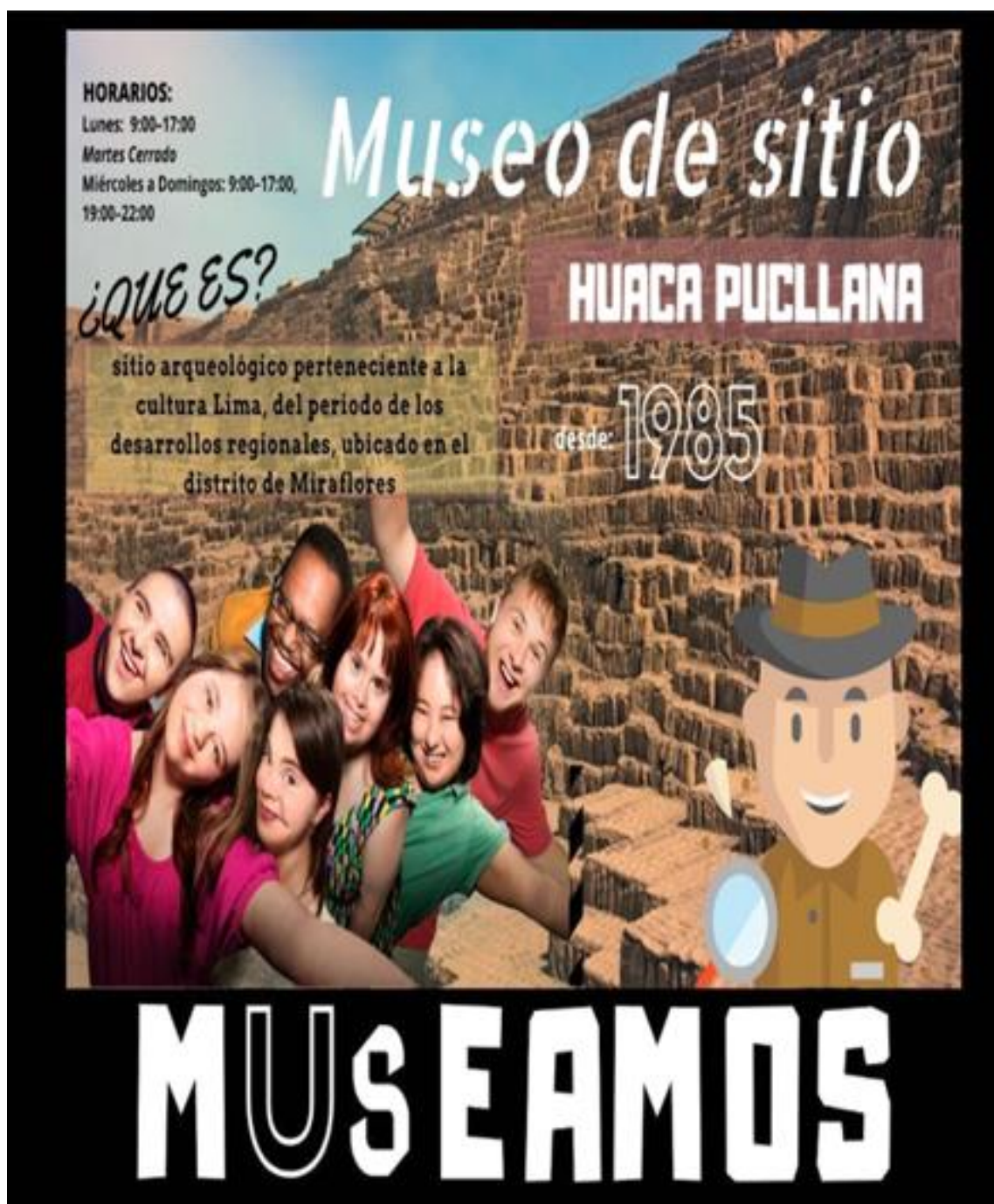
Imagen 26: Modelo de afiche publicitario