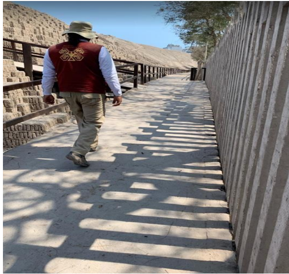
Área de subida a la gran pirámide