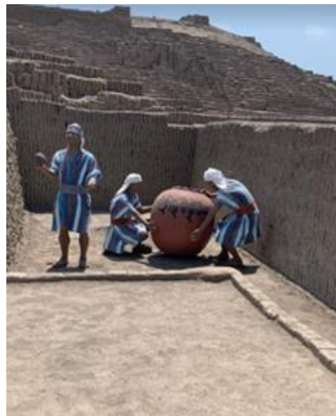
Imagen 24: Explicación mediante personajes