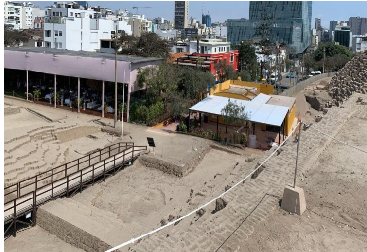
Área de Plaza de los Hoyitos