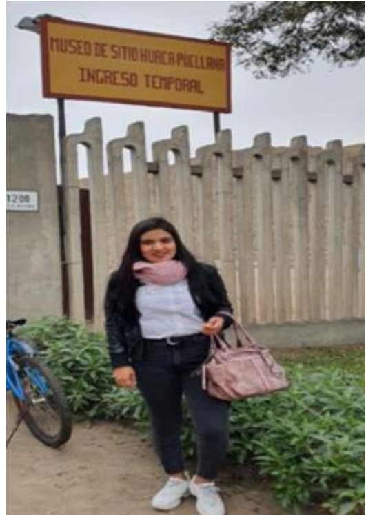
Imagen 22: Visita a la Huaca Pucllana