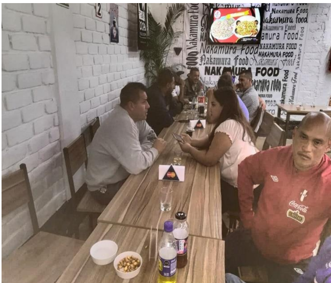
Figura 5: Foto entrevistando a uno de los futbolistas.