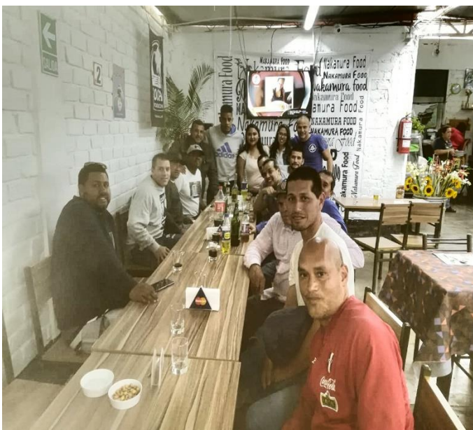
Figura 7: Foto con jugadores del Boys, Alianza Lima y Cristal.