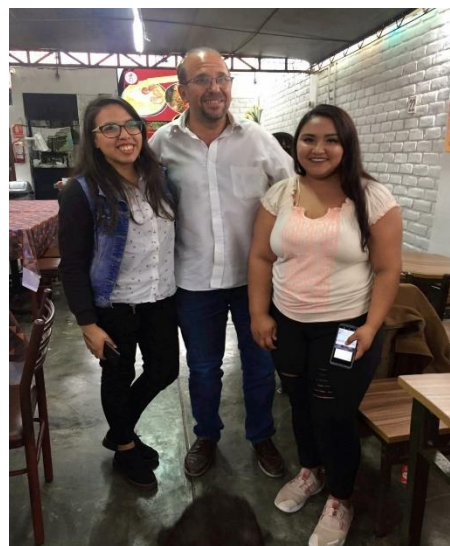
Figura 6: Foto con un periodista de futbol.