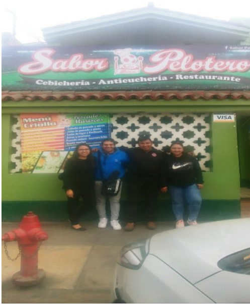
Figura 1: Foto con exfutbolistas del Boys.