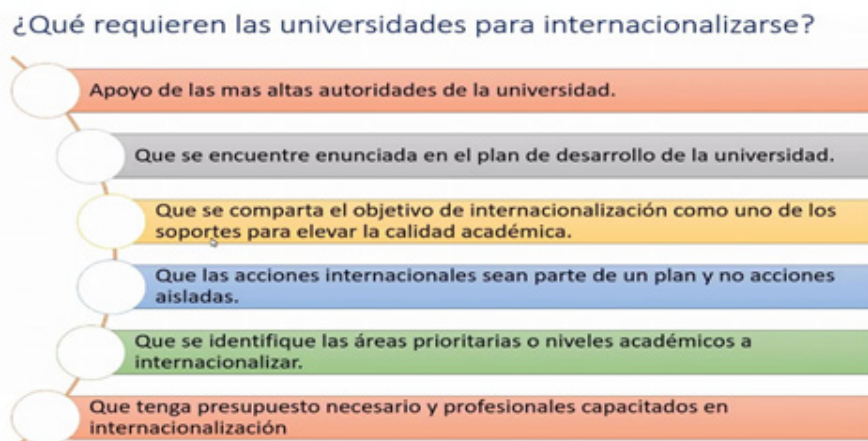
Figura 2. Las universidades requieren para internacionalizarse de estar enunciados en un plan, que se identifique áreas prioritarias y que se comparta objetivos de transformación de la imaginación teórica de articular la labor de las ciencias sociales de producir, compartir y contrastar conocimientos críticamente contextuales y relevantes.