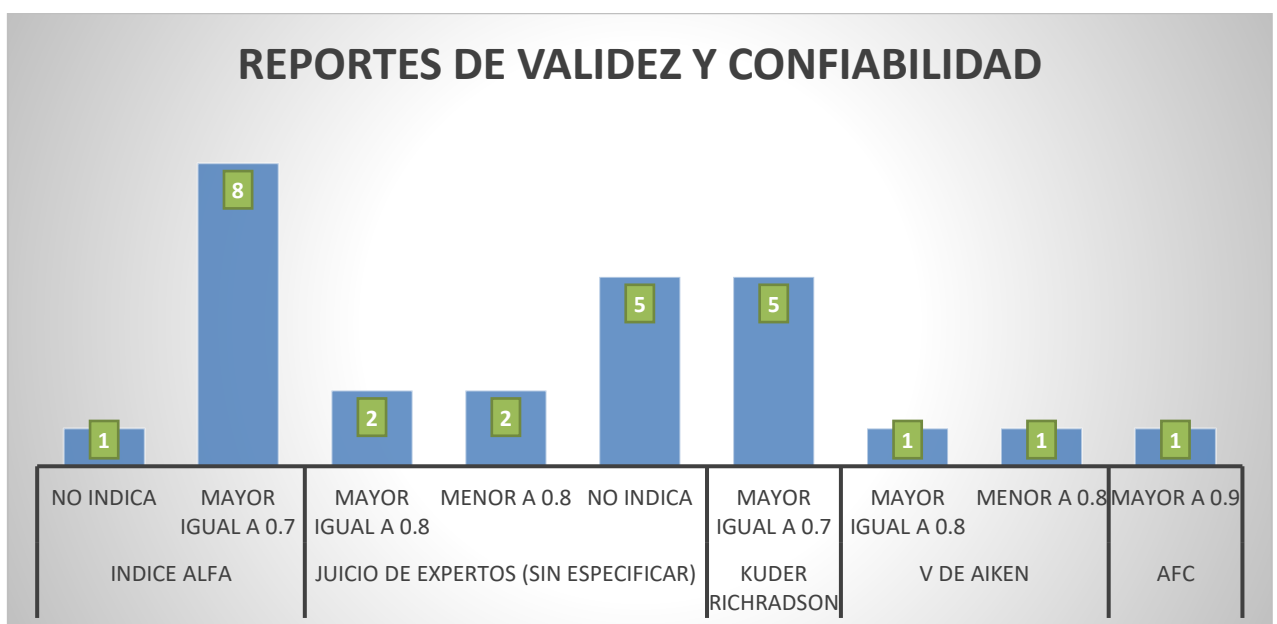
Reportes de validez y confiabilidad de los estudios de la escala del clima social familiar FES