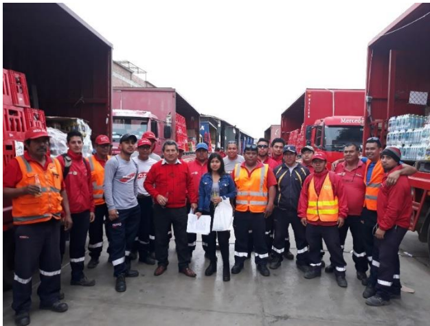
Foto4: Foto grupal con los trabajadores y el administrador de la empresa REGZA SRL – CHOCOPE, 2019.