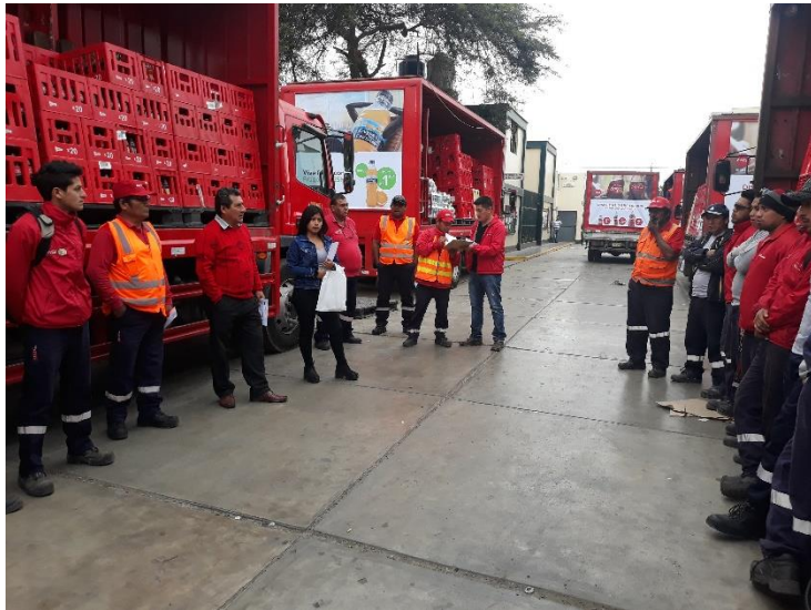
Foto 1: Comunicando al área de distribución y reparto sobre el cuestionario