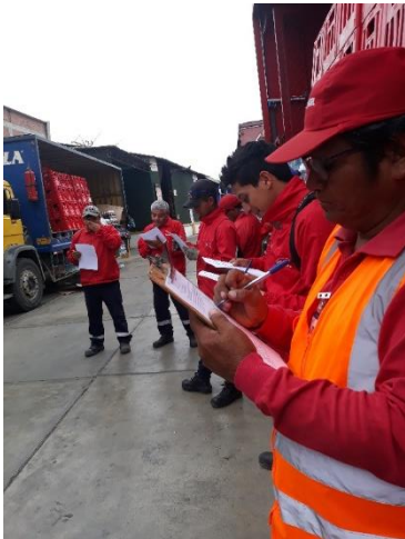
Foto 2: El área de distribución y reparto desarrollando el cuestionario.