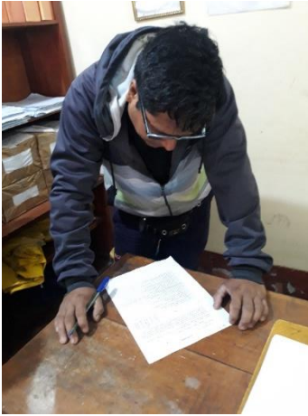
Foto3: uno de los trabajadores del área de almacén, desarrollando el cuestionario.