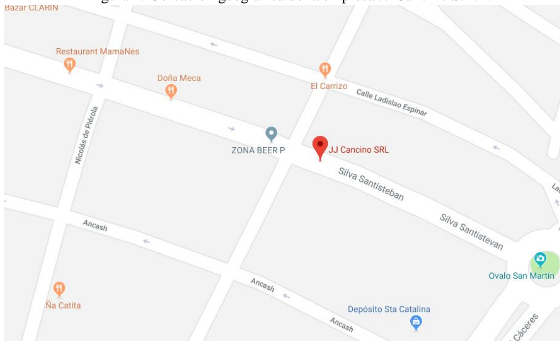
Figura 1: Ubicación geográfica de la empresa JJ Cancino S.R.L.

La ubicación de la empresa de transporte JJ Cancino S.R.L es en la calle Jr. Silva Santisteban 394 de la ciudad de Pacasmayo.