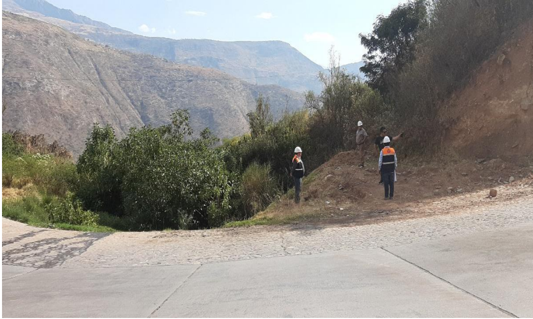
Figura 13 Suministro e instalación de tubería de alcantarillado con PVC-UF DN 315 MM.}