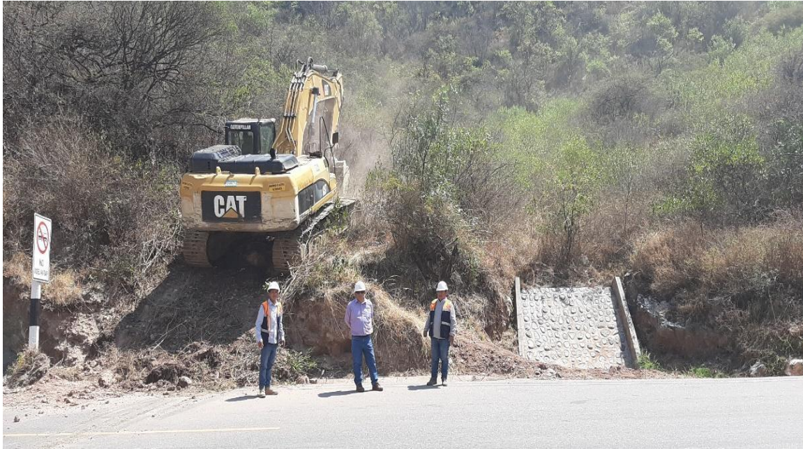
Figura 5 Apertura de trocha carrozable con maquinaria excavadora.