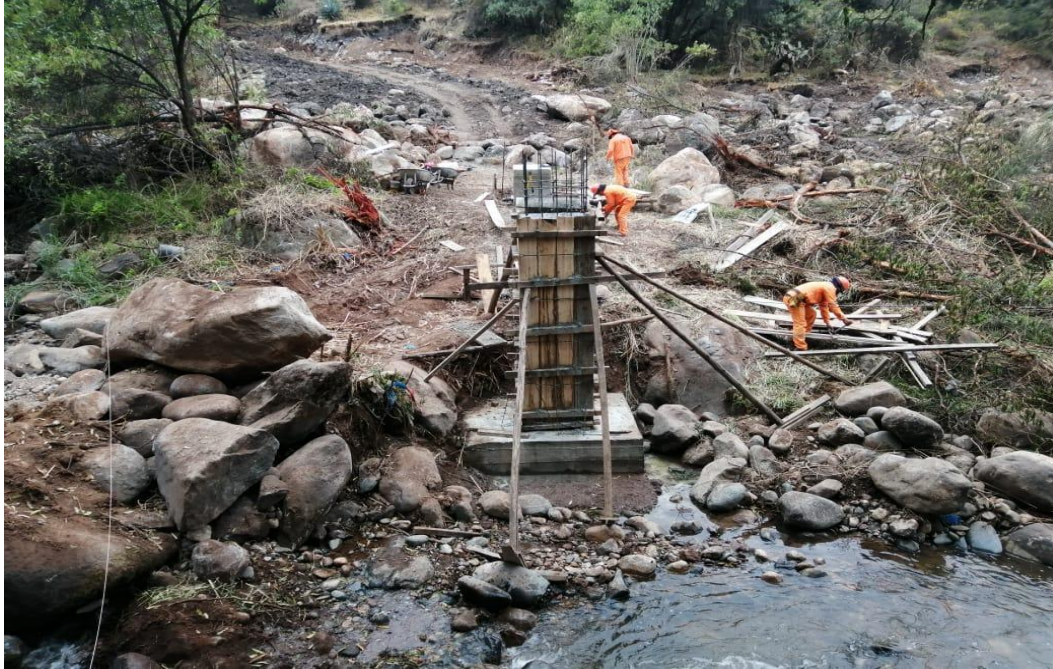
Figura 15 Encofrado y vaciado de concreto FC=210 \text{ Kg/cm}^2 de la columna del pase aéreo.