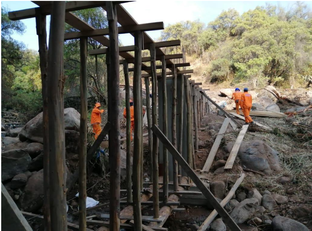
Figura 16 Encofrado del pase aéreo de la base en el río Chincheros