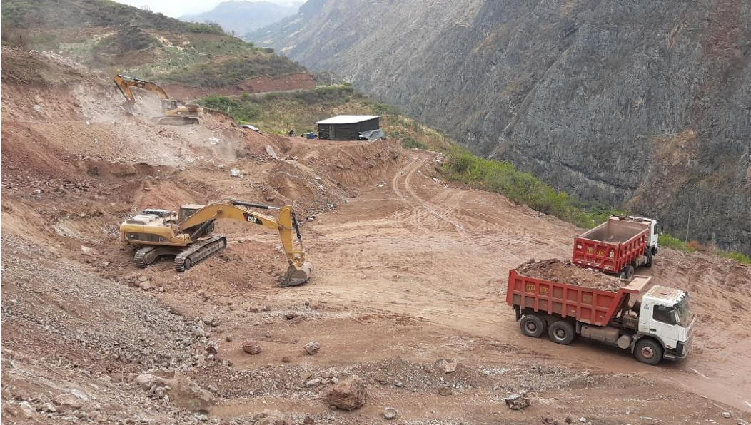
Figura SEQ Figura 1* ARABIC 3Excavación masiva en la pta. de la laguna de maduración.