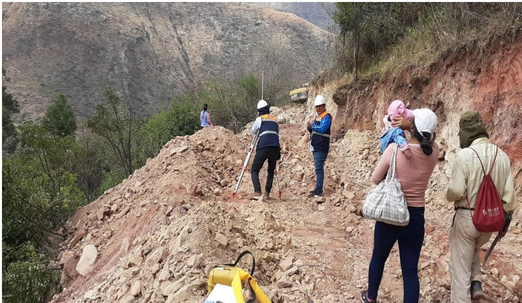
Figura 8 Apertura de acceso y control topográfico en la zona de Muyurcco