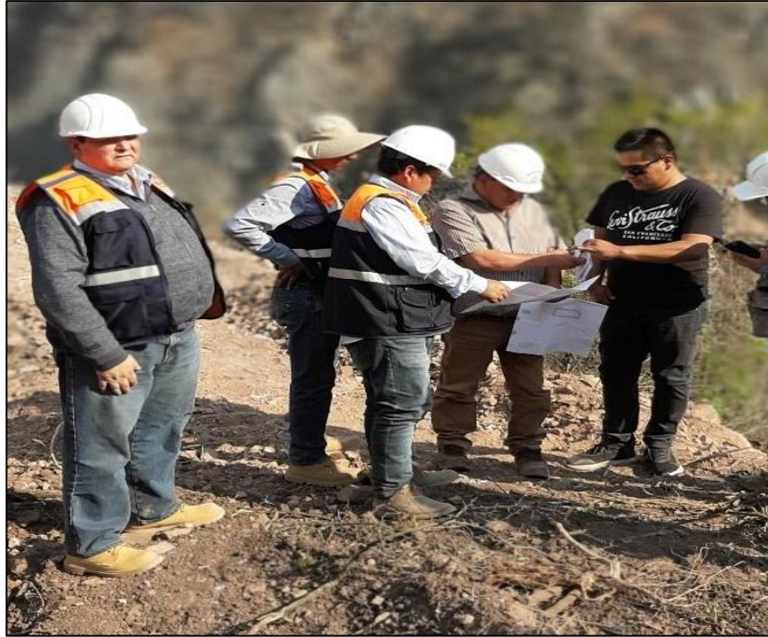
Figura 11 Presencia del supervisor verificando los trabajos de campo.