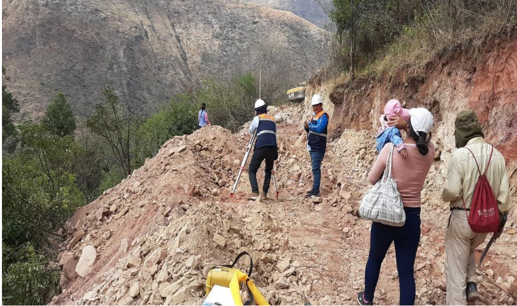
Figura 9 Apertura de acceso y control topográfico en la línea de emisor.