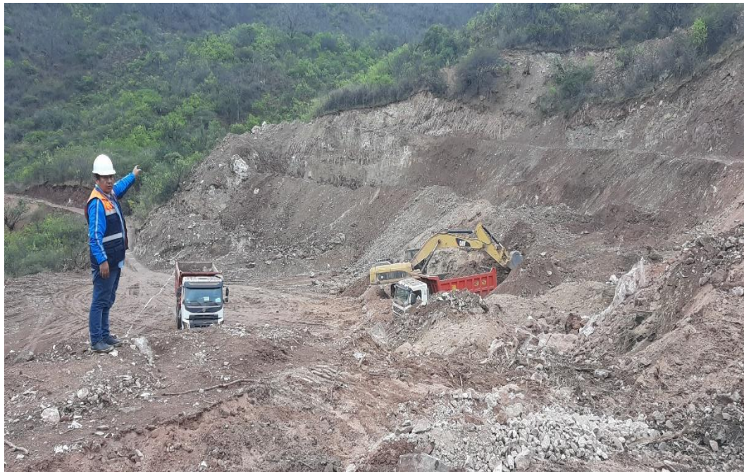
Figura 6 trabajos de excavación masiva en la PTAR de la laguna de maduración