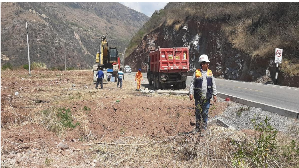
Figura 4: Maquinarias desplazándose a la PTAR -inicio de trabajo.