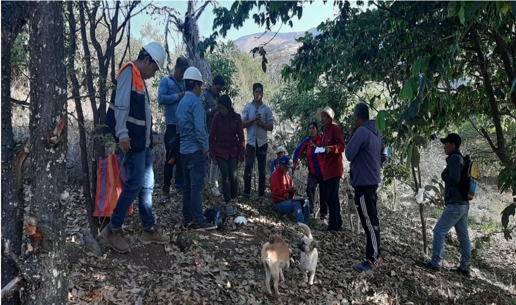
Figura 7 Charlas de sensibilización a los beneficiarios de la zona