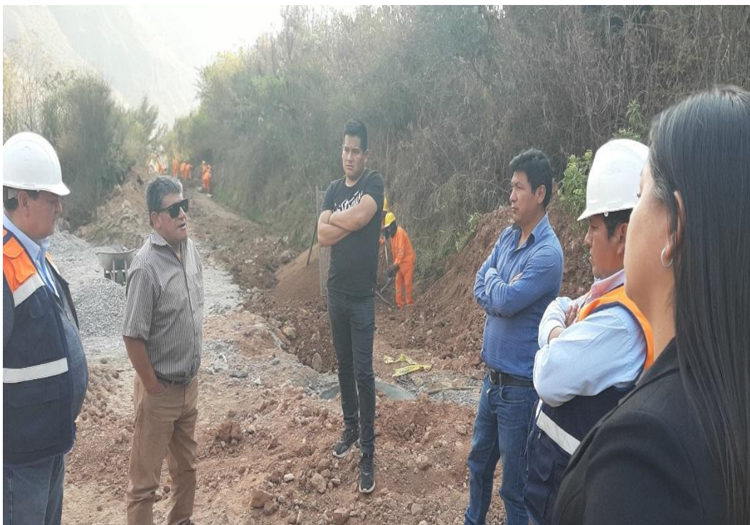
Figura 10 Presencia de los responsables de la obra en ejecución.