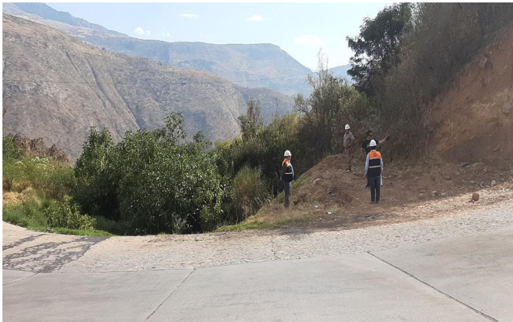
Figura 12 Verificación de los trabajos de campo en el badén con la presencia de la supervisión para la apertura de nuevo frente de trabajo.