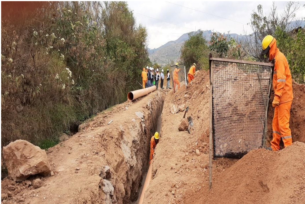
Figura 14 Recorrido de la obra con presencia del monitor del ministerio de vivienda, supervisor de obra, residente y los ingenieros de la municipalidad.