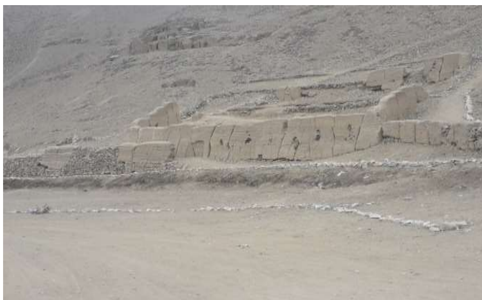
Palacio de Oquendo