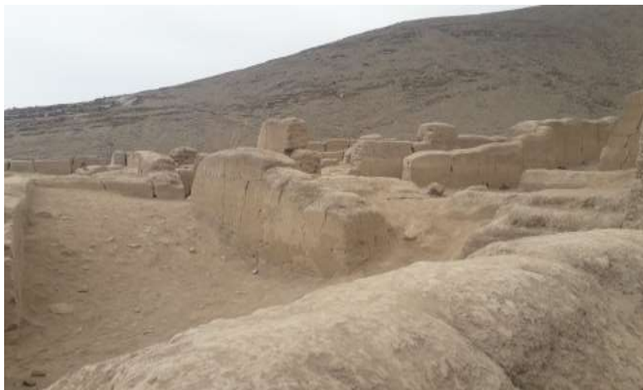
Vista lateral del palacio de Oquendo