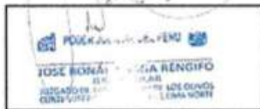
Firma y sello del entrevistado

fecha la nueva normatividad de la violencia contra la mujer y el grupo familiar, pero es un tema que no se da abasto por la excesiva carga procesal, la capacidad del personal, la policía no tiene el personal capacitado, especializado para saber qué es lo que se quiere lograr con el seguimiento, un ente social o un psicólogo que cuando va a ver ayude. Sabemos que la fiscalía y la policía se están especializando, pero tienen que experimentarse porque parece sencillo, pero no lo es. Hay que ver si la víctima está diciendo la verdad, porque vas a su casa, te dicen sí, porque depende el agresor está por allí, le está mirando, le está amenazando, hay muchas formas de inducir la respuesta de la víctima. Yo creo que eso habría que manejarlo con una política de preparación, de especialización, entonces es bueno si se puede poner un organismo especializado para que haga el seguimiento de las medidas de protección. Debe ser una institución, el Ministerio de la Mujer, por ejemplo, va a colapsar también, el Poder Judicial también es un ente multidisciplinario, se podría poner asistentes sociales para que puedan hacerlo, igual la policía, igual la fiscalía, igual la municipalidad, etc. Tendría que manejarse una política más agresiva donde se pueda fiscalizar i se ha cumplido la medida de protección.