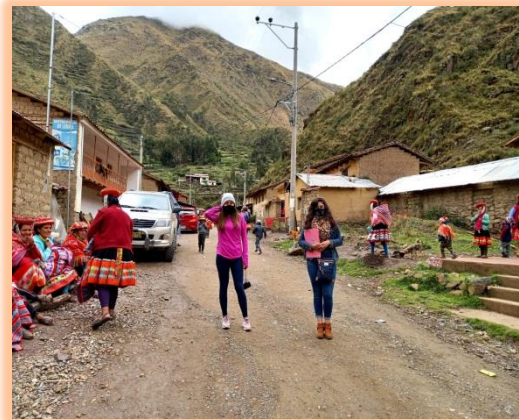
Descripción: Conociendo sobre la Comunidad de Huilloc.