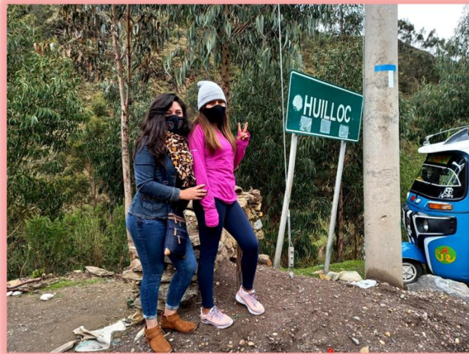
Descripción: Despidiéndonos de la Comunidad de Huilloc.