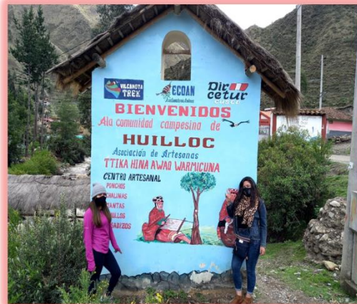
Descripción: Llegando a la Comunidad de Huilloc.