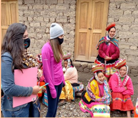
Descripción: Socializando con los las pobladoras de Huilloc.