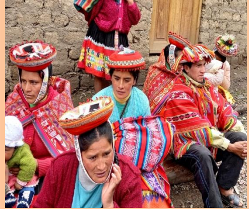
Descripción: Algunos Pobladores de la comunidad.