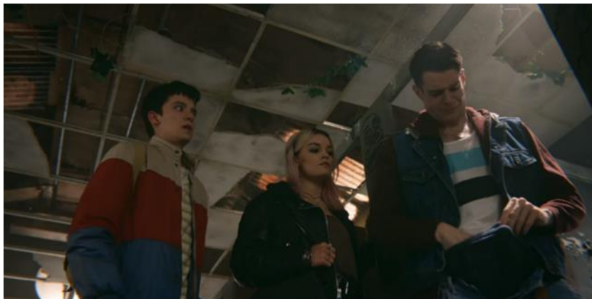
Otis y Maeve ayudan a Adam con su problema de erección

Maeve va por indicación del profesor a buscar a Otis tras el video que difundieron de su mamá en toda la escuela y, repentinamente, oyen gritos dentro de los baños. Al entrar, podemos oír un instrumental como elemento extradiegético que acompaña a la escena mientras Otis y Maeve encuentran a Adam con un problema de erección, mostrando un temperamento melancólico en un inicio. Él les pide ayuda a lo que Otis se niega por haberse burlado de su madre, luego de insistir, Otis le aconseja adueñarse del problema que lo aqueja de ser hijo del director y que las personas hablen de su miembro, siendo eso una situación que le afecta de forma emocional. El instrumental cambia en el momento que Adam se abre un poco más en la conversación, volviéndose más sensible al contar lo que le pasa en su vida. Este hecho es el primer detonante en la serie al evidenciarse el talento que tiene Otis de aconsejar a los demás.