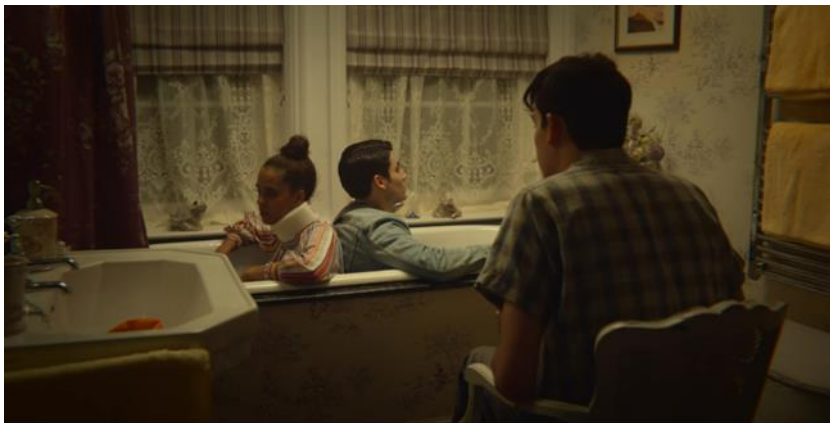
Otis aconsejando a Kate y Sam en el baño de Aimee

Otis, después de sus fallidos intentos por conseguir pacientes para la clínica en la casa de Aimee, entra al baño y encuentra a Kate quien le comenta el problema que tiene con su pareja Sam. Posteriormente él, buscando a Kate, la encuentra con Otis y la pareja empieza a discutir. Otis, mostrándose flemático, pide que se calmen y les brinda – sin planearlo- terapia. Sam se muestra como una persona sanguínea, pues disfruta de la compañía de Kate quien cree que él miente; sin embargo, ella demuestra que también le gusta estar con Sam solo que no se siente segura de sí misma y finalmente termina aceptándose. En esta escena no hay banda sonora de fondo, lo cual crea un ambiente de confianza por lo que Otis escucha y atiende los problemas de la pareja; luego de solucionar la situación, comienza a sonar una canción que denota el cumplimiento de su objetivo.