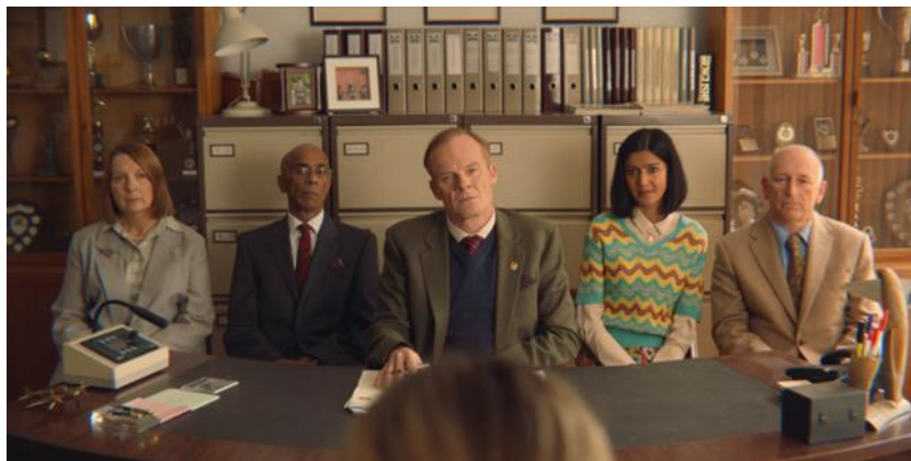
Maeve se presenta al juzgado de la escuela

Maeve, aceptando que las drogas encontradas por el sr. Groff en el baile son suyas, es condicionada por el director de pasar al juzgado de la escuela. Este hecho lo posiciona como antagonista, pues impide la estadía de Maeve hasta que se tome una decisión al respecto. Sin embargo, procediendo con los protocolos de Moordale, tiene derecho de defenderse para no ser expulsada. Ella, mostrándose flemática, expresa las virtudes que posee como estudiante; el director, sanguíneo, se muestra serio ante la apelación de la estudiante. Esta escena posee un sonido extradiegético que denota la compasión que pide Maeve para quedarse, tras aceptar que no cuenta con el apoyo emocional de su familia.