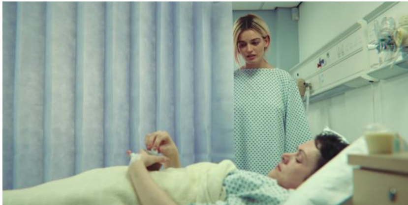
Maeve dialoga con Sara luego de su operación (aborto)

Al despertar de su intervención, Maeve recibe alimento de la enfermera quien va también a la cama de Sara y tiene una pequeña discusión con ella por el sabor del postre. Luego de escucharla, Maeve va para darle de su postre mostrándose reflexiva porque, su actitud, denota que identifica en Sara una figura materna. Del mismo modo, Sara se muestra melancólica porque se sensibiliza con Maeve al crearse un fugaz vínculo entre ellas. Esta escena tiene presente sonidos delicados que desaparecen en los diálogos lo que demuestra la cercanía y el cariño que se generó entre ambos personajes.