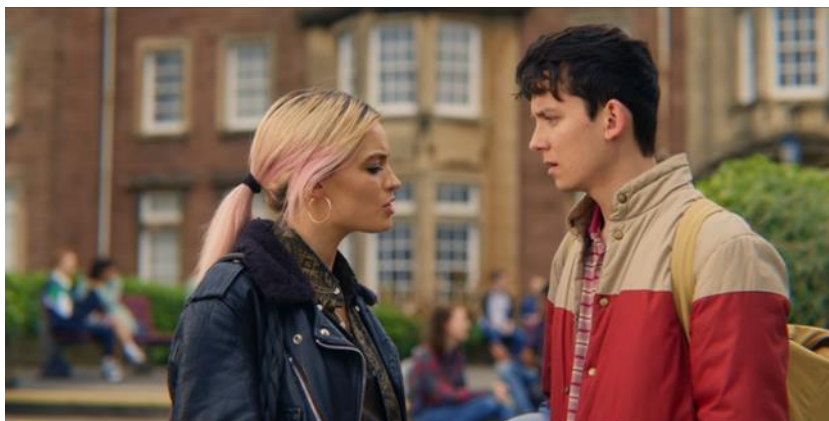
Maeve le propone a Otis un negocio de terapia sexual para los estudiantes

Los dos protagonistas dan el punto de giro a la historia en el momento que Maeve le propone el negocio de terapia sexual a Otis, luego de enterarse que sus consejos ayudaron a Adam. Ella se muestra con un temperamento sanguíneo por lo que sabe que ambos harían un buen equipo, Otis se muestra flemático, ya que, no entiende el motivo por el cual Maeve le comenta los problemas sexuales que tienen algunos estudiantes en la escuela. Finalmente, ella le menciona la propuesta y él, dudoso, no sabe si quiere aceptar haciendo que Maeve quiera irse por lo que él termina diciéndole que sí, dando inicio al negocio. Esta escena inicia con un sonido diegético, pues se escucha lo que hay a su alrededor y finaliza con una canción cerrando así el primer episodio de la serie.