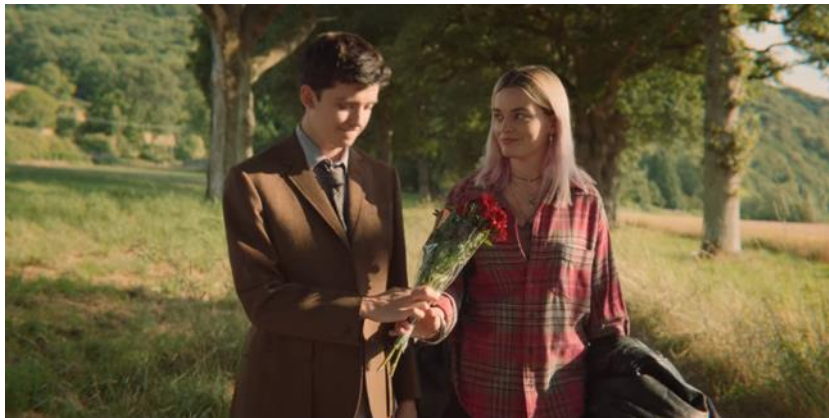
Otis acompaña a Maeve a su casa tras su operación (aborto)

Otis espera a Maeve hasta que salga de su intervención teniendo un regalo para ella. En el camino, Otis le habla sobre su madre y, de igual forma, Maeve le dice datos delicados sobre su mamá y también habla de su hermano. En esta escena ambos protagonistas son sanguíneos porque disfrutan la compañía del uno al otro, el sonido diegético de la naturaleza mientras caminan muestra la conexión entre ellos y, al llegar a casa de Maeve, el sonido extradiegético establece un fortalecimiento en el cariño que se tienen.