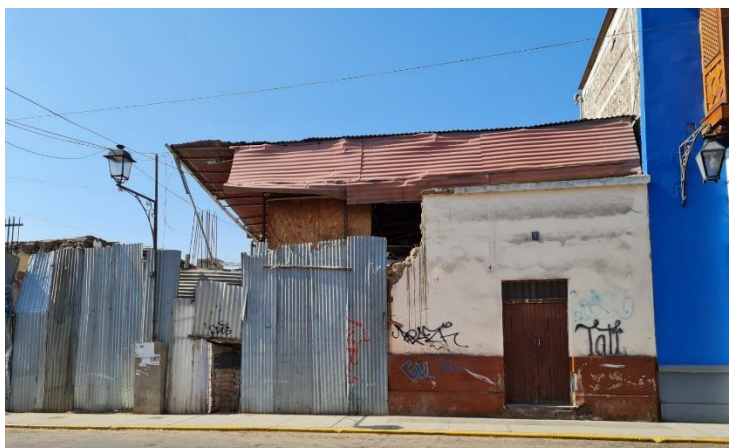
Jr. gamarra 333