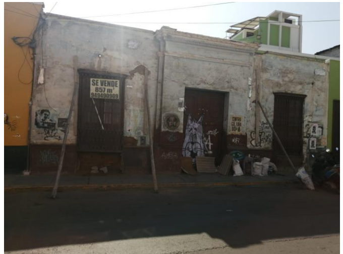
Jr. san Martín 647