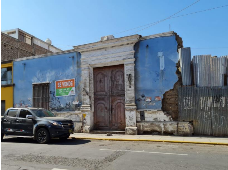
Jr. gamarra 315