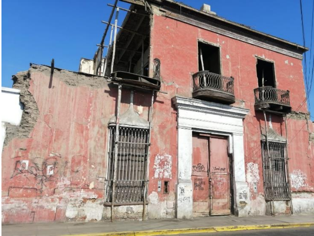
Jr. San Martín 880