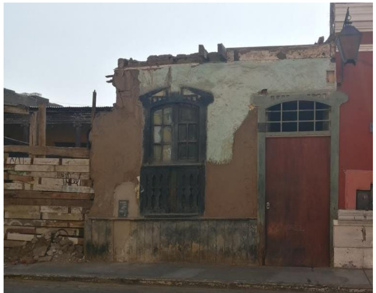
Jr. San Martín 783