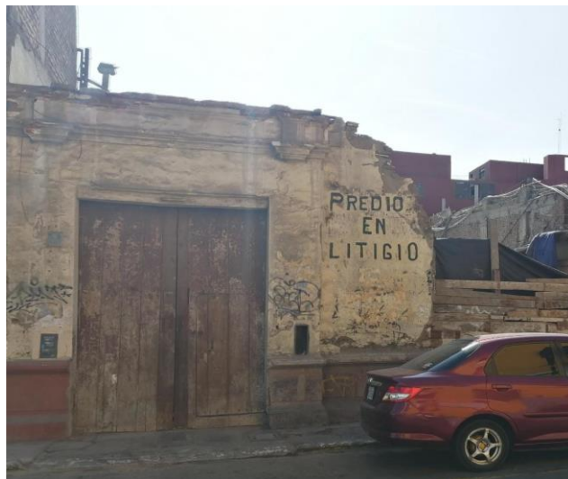
Jr. San Martín 773