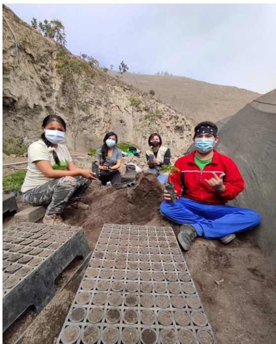
Figura 4 Actividades de voluntariado con la Organización