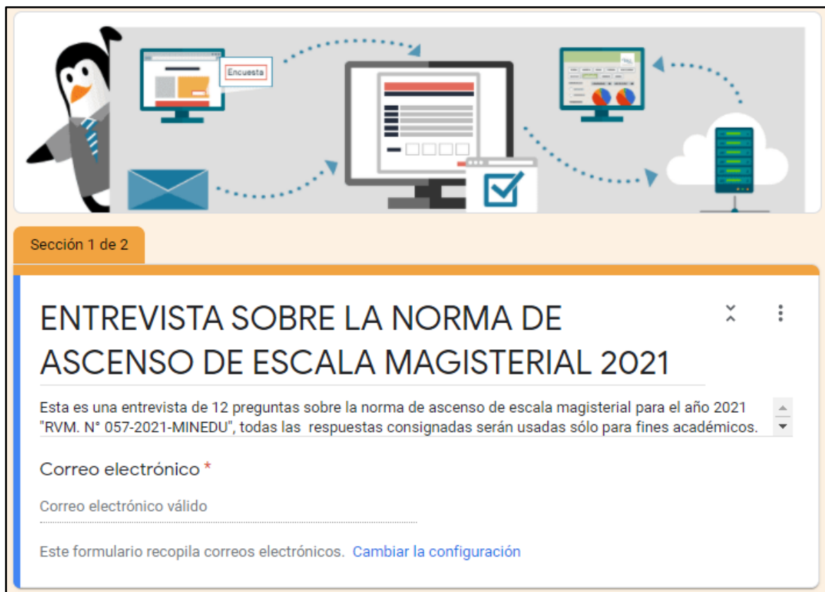
Figura 18: Formulario de entrevista