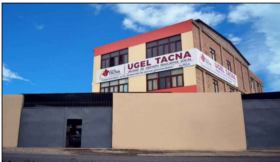
Figura 4: Sede UGEL Tacna.

El presente trabajo de investigación se desarrollará en el ámbito de la jurisdicción de la UGEL Tacna, la cual está delimitada en la provincia de Tacna de la región de Tacna, y en la actualidad toda esa información se encuentra alojada en la sede de la UGEL Tacna, y está localizada en la avenida Jorge Basadre 415, mediante documentos de gestión emitidos por los directores de cada institución educativa, de la jurisdicción de provincia de Tacna.