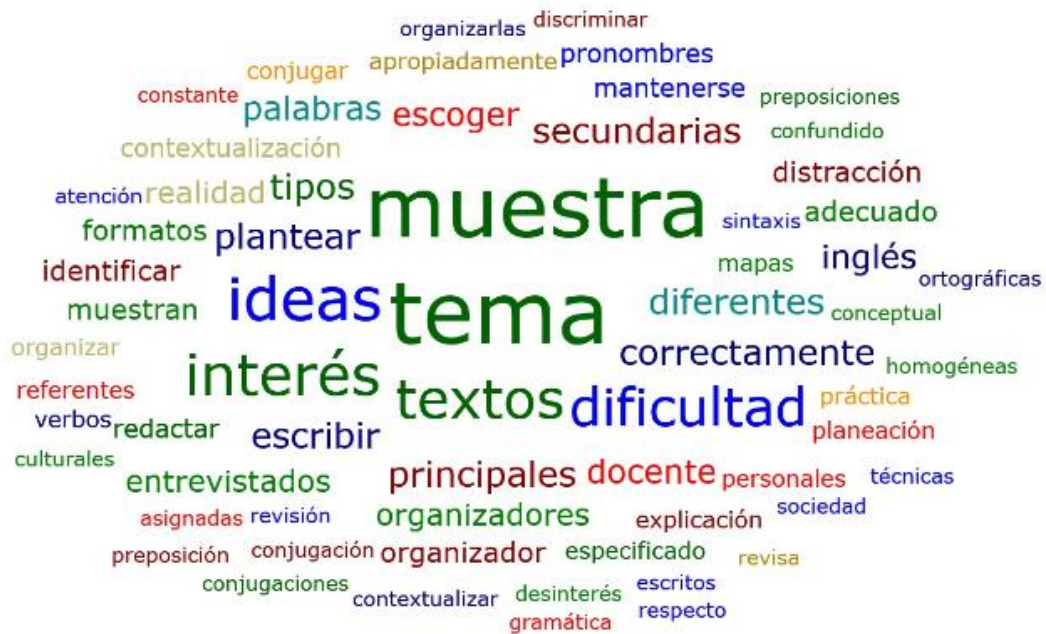
Figura 2: Nube de Palabras

A partir de la figura 2 se presenta el análisis de la información de la categoría de Producción de textos; de la cual se desglosan las tres subcategorías; planeación, contextualización y revisión; la cuales fueron propuestas para el desarrollo de la investigación y a su vez permiten dar respuesta a los objetivos propuestos, teniendo como resultados las palabras con más grado de frecuencia en el análisis de la información