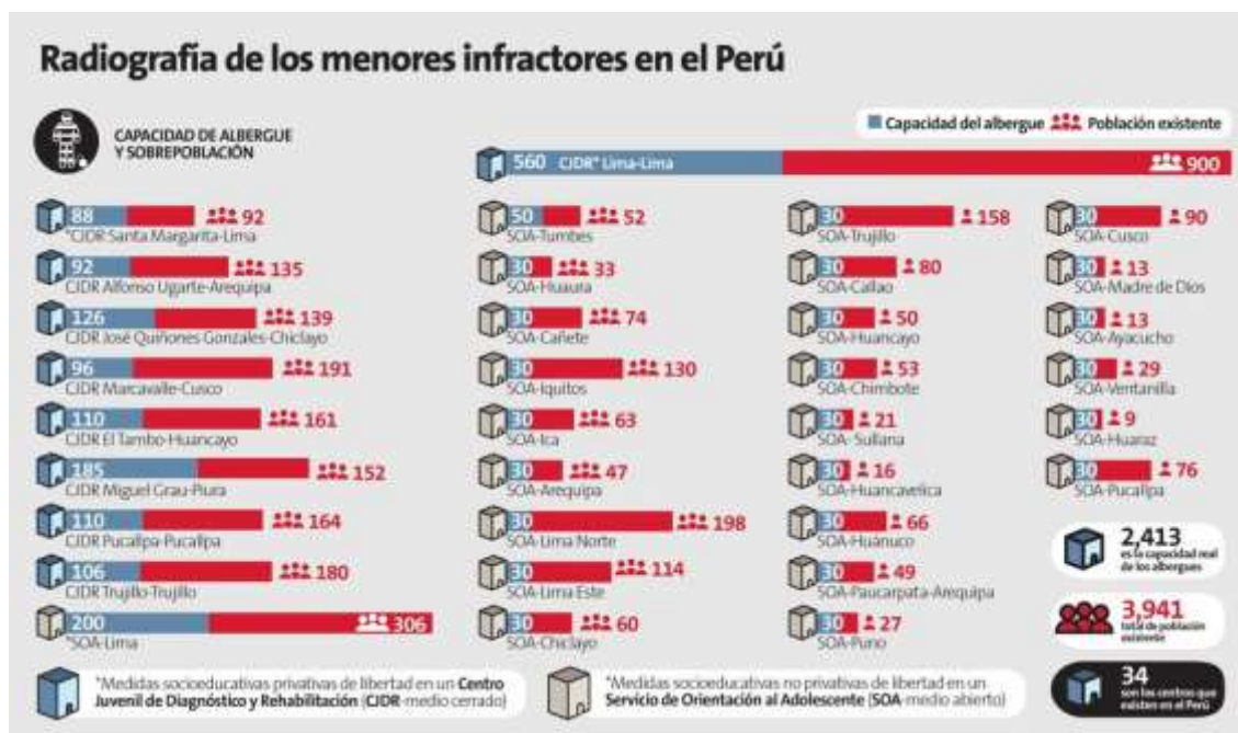
Figura 1. Radiografía de los menores infractores en el Perú

Pero es notorio que en todos los centros de atención la capacidad del albergue es sobrepasado por la población existente, siendo el peor de estos casos el de Lima que cuenta con una capacidad de 560, pero alberga a 900, siendo también casos preocupantes los de Trujillo, Iquitos y Cusco, superando en más del 100% su capacidad.