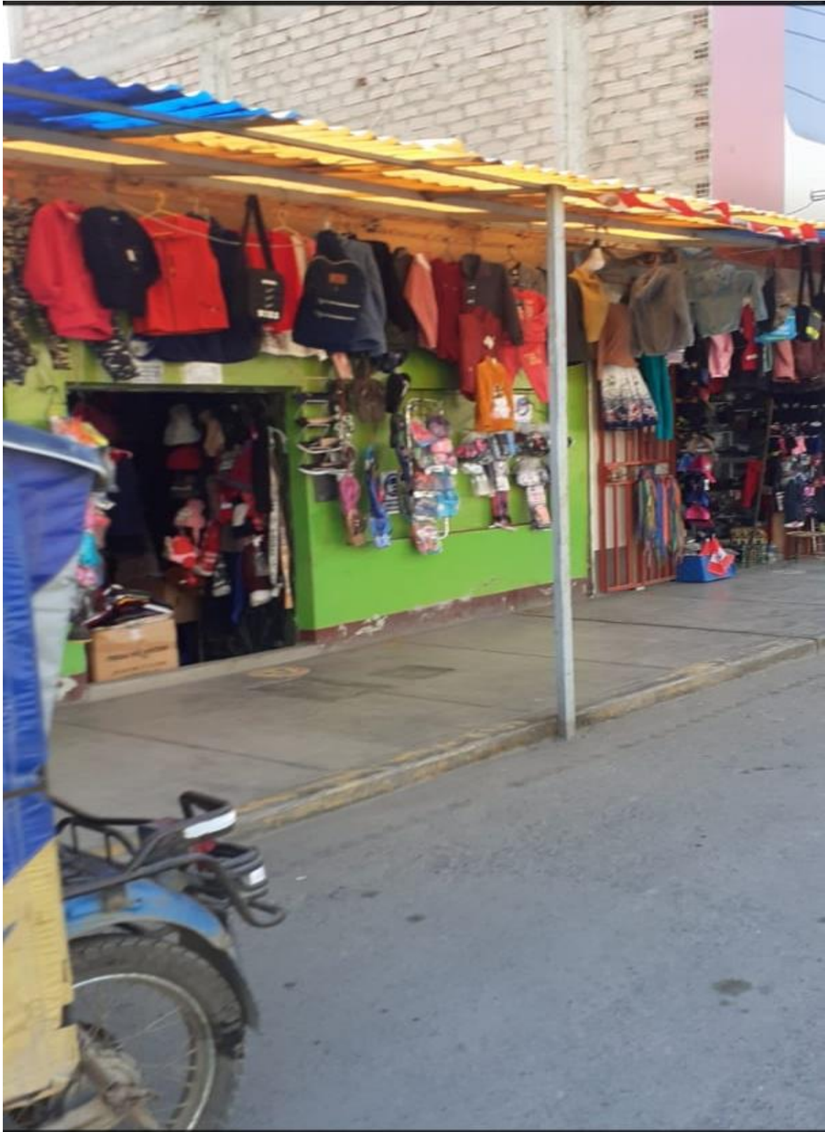
Cuadro 12: Fotos de Evidencia de Aplicación de Instrumentos