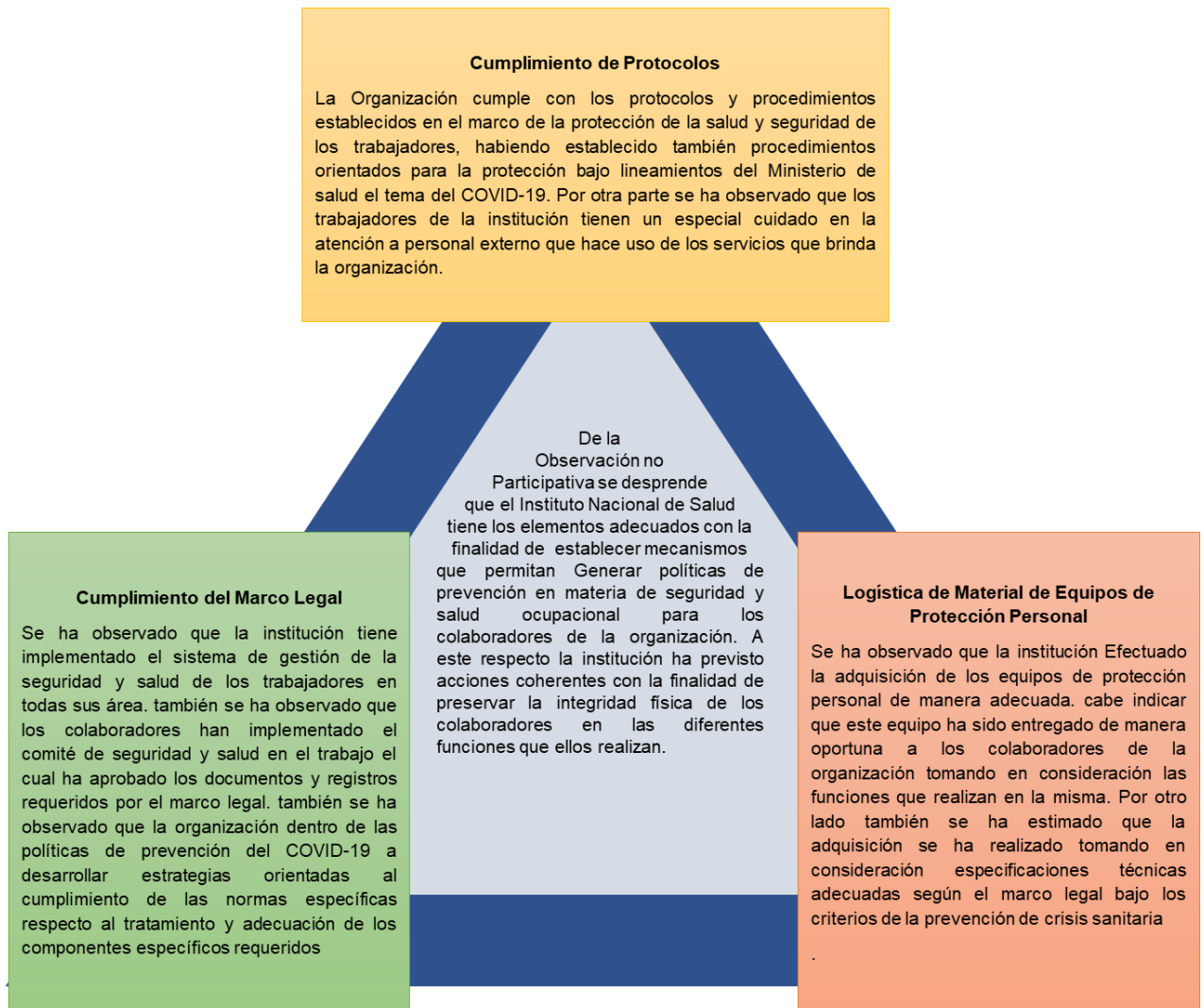
Figura 2 Triangulación del análisis Observacional de la unidad de estudio

Del análisis observacional se desprende que sobre el cumplimiento de los protocolos; se puede observar que la organización ha tenido especial cuidado en la observancia de los protocolos y procedimientos establecidos en el marco de la ley de seguridad que están buscando trabajo implementando Adicionalmente medidas orientadas a la prevención de la crisis sanitaria debido a la COVID-19 dentro de la organización. Se observó también con respecto a los protocolos éstos han sido debidamente impartidos dentro del personal que labora en la institución dotándoles adicionalmente desde elementos de protección personal para su uso diario los cuales se encuentran en perfectas condiciones y son debidamente utilizados por el personal de la indicada organización.