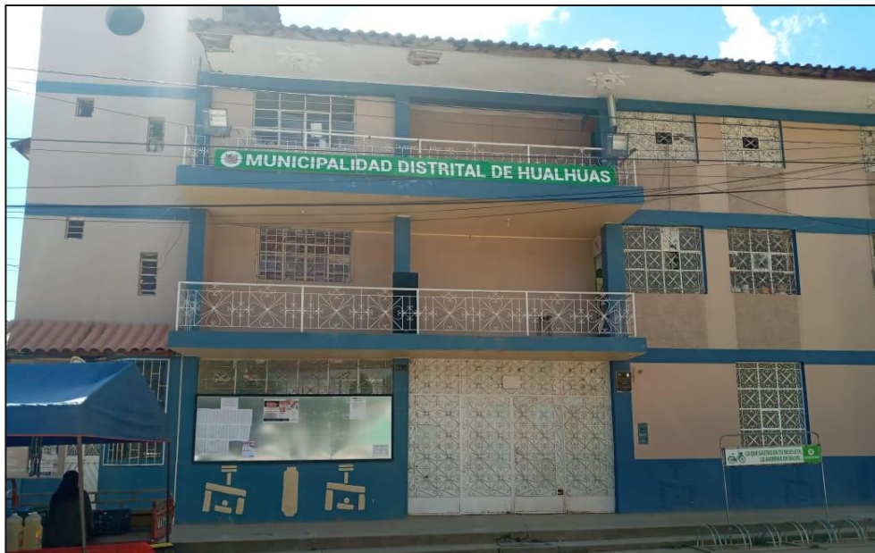
Municipalidad de Hualhuas. (2021). [Imagen].