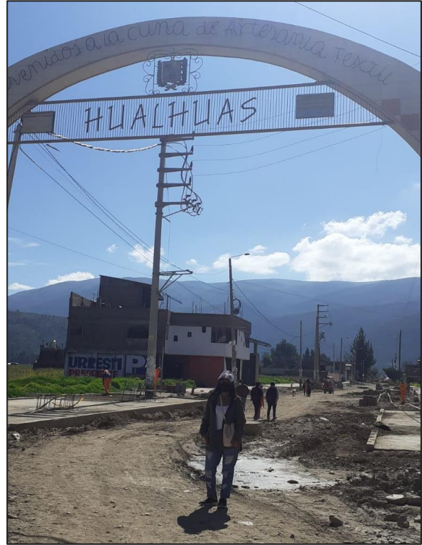
Arevalo, L. (2021). Distrito de Hualhuas. [Imagen]. Cordova, H. (2021). Distrito de Hualhuas. [Imagen].