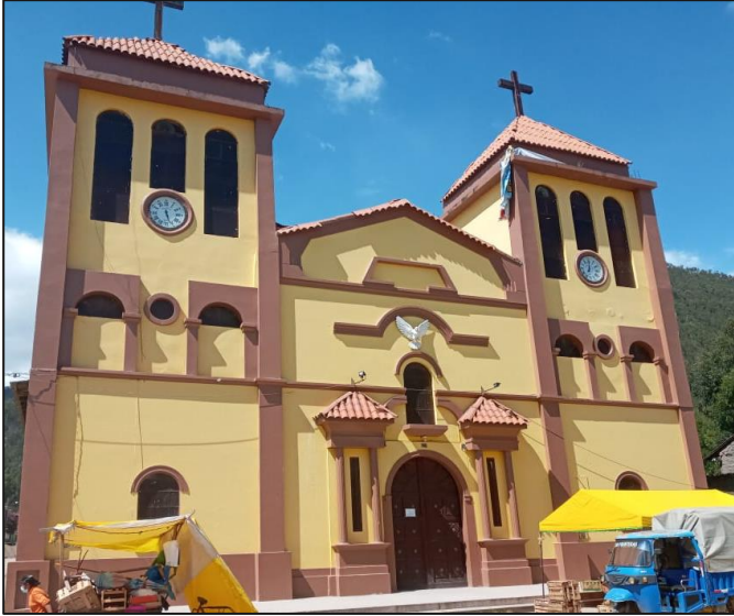
Iglesia de Hualhuas. (2021). [Imagen].