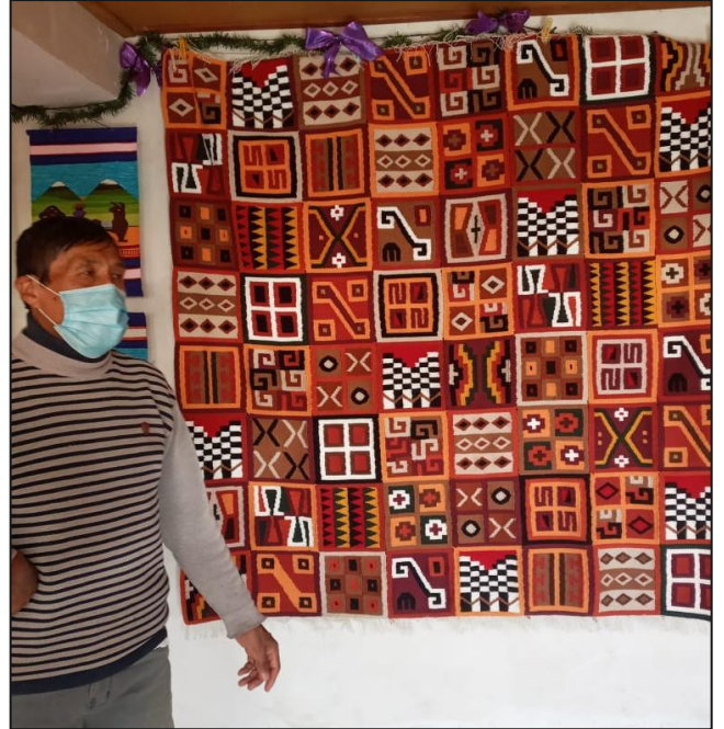
Ingarroca, V. (2021). Distrito de Hualhuas. [Imagen].