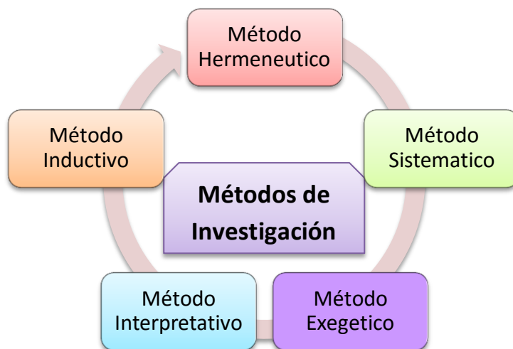
Figura 2: Método de análisis de la información

Método inductivo , este parte de lo específico a lo general, es decir que está dirigido a la recopilación y unión de información que pueden ser los pequeños aportes que se hacen para luego llegar a una conclusión general.